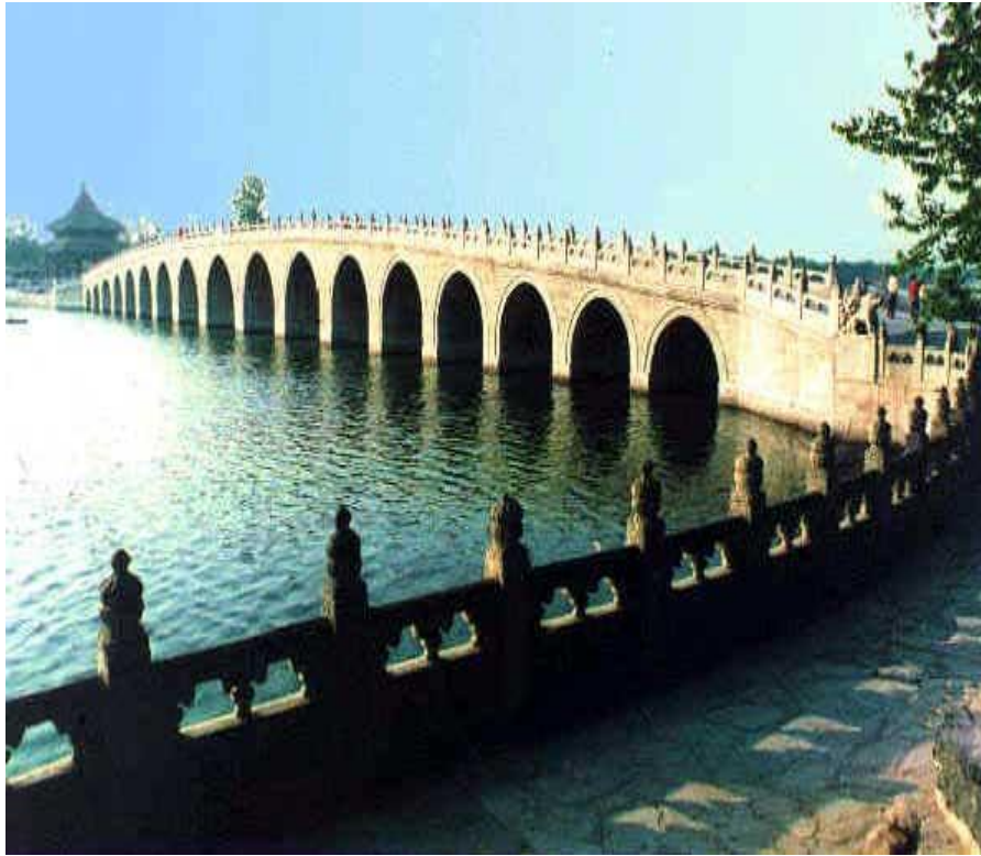
昆明湖 Озеро Куньминху