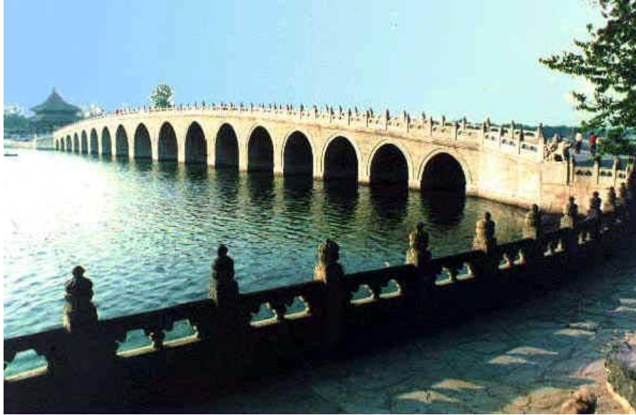
昆明湖 Озеро Куньминху