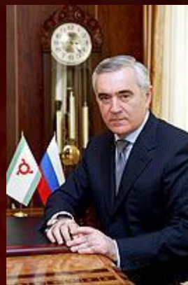
Мура́т Магоме́тович Зя́иков