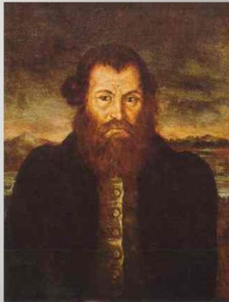
Мирон Ефимович (1803-49)