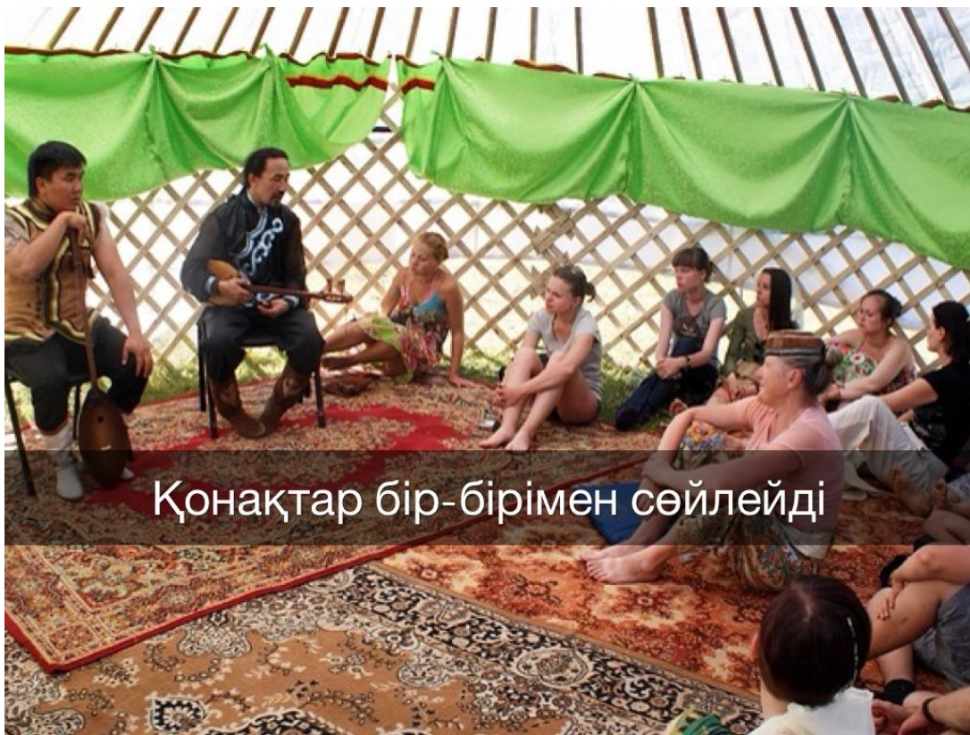
Қонақтар бір-бірімен сөйлейді

Адамдар арасындағы сыйластықты, бір-біріне деген құрметті , қамқорлықты білдіретін, кісінің адамгершілігін , имандылығын айқындайтын қасиет.