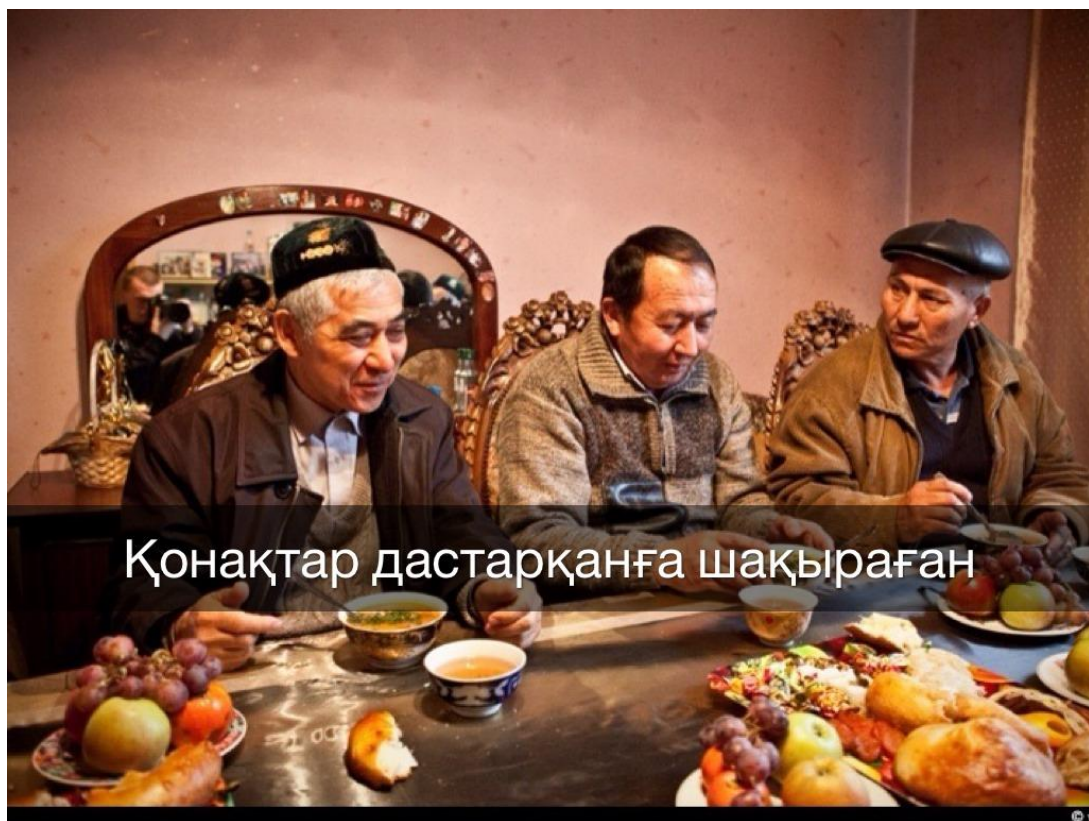
Қонақтар дастарқанға шақыраған

Дастархан басында өзін өзі ұстай білу, ұнасымды отырып, әдемі тамақтана білу де адамның мәдениеттілік деңгейін көрсететін сипат болып табылады.