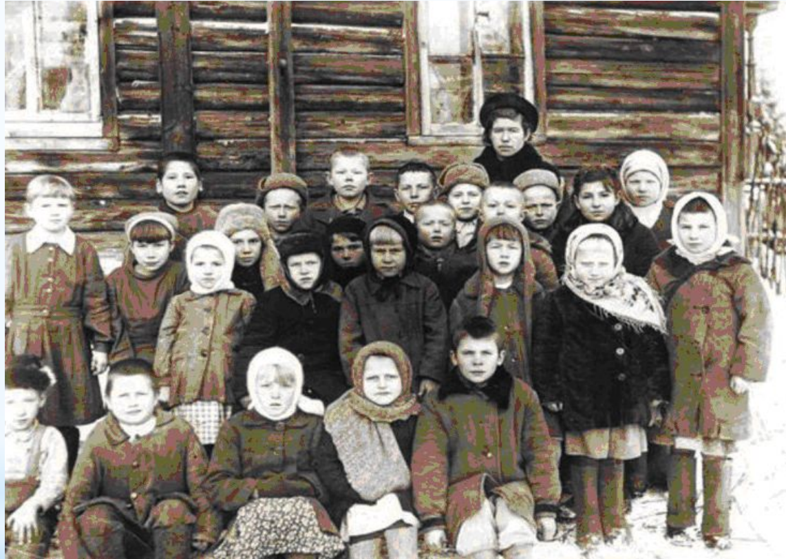
Ученики после революции 1917 года

После революции 1917 года школьная форма на время исчезла.