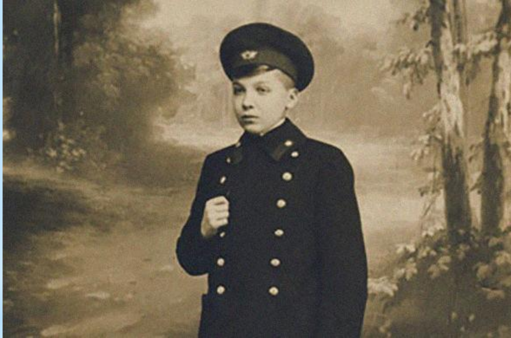
Образец школьной формы, утвержденной Николаем I

Первое свидетельство появления школьной униформы датируется 1834 годом . Тогда Николай I издал указ, утвердивший отдельный вид гражданских мундиров . К ним относились гимназические и студенческие мундиры.