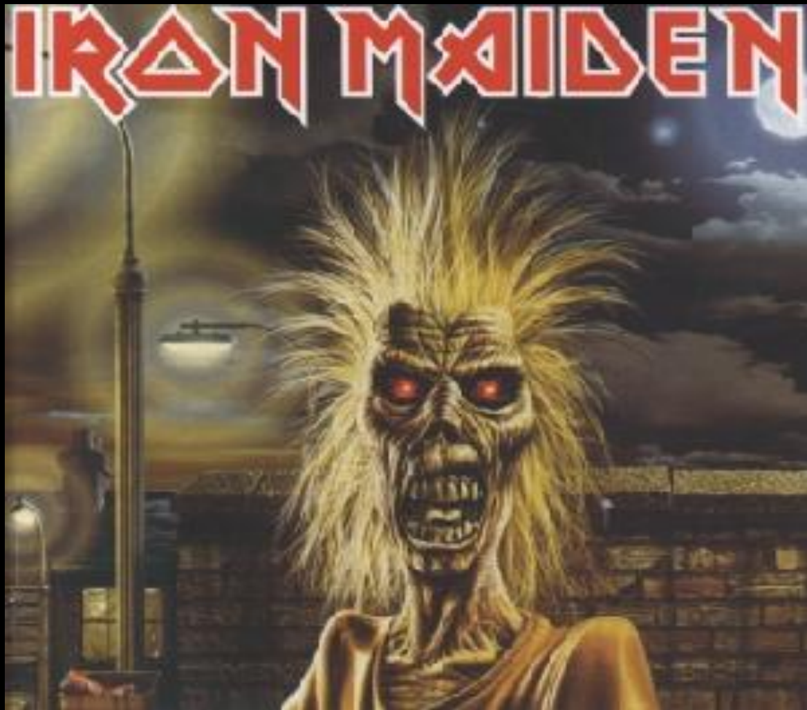
Iron Maden – «Iron Maden»