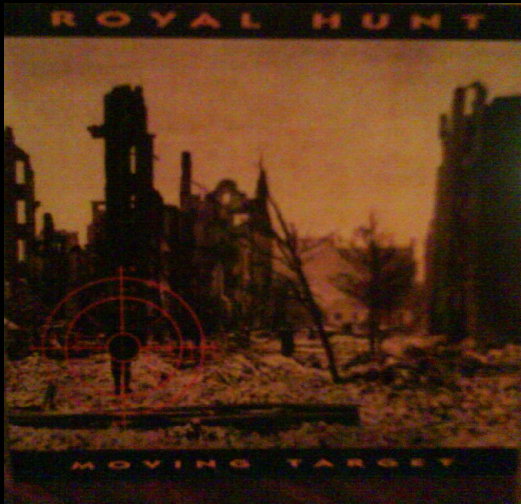
Royal Hunt – «Moving Target»