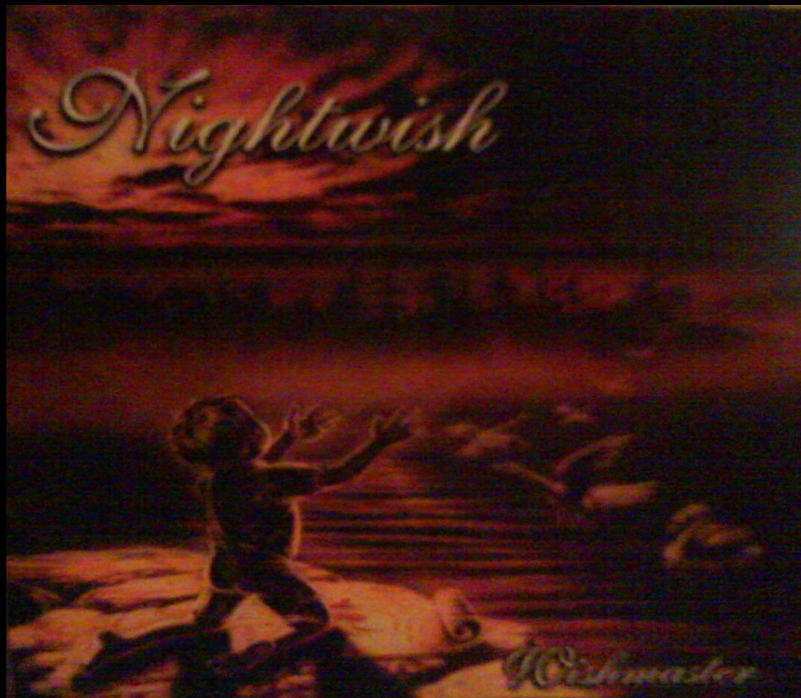
Nightwish - «Wishmaster»