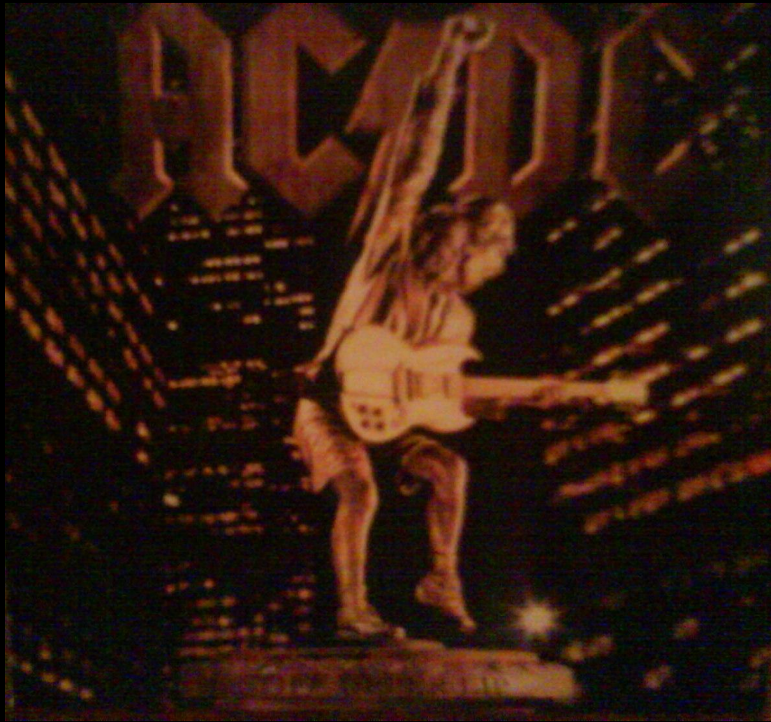
AC/DC – «Stiff Upper Lip»