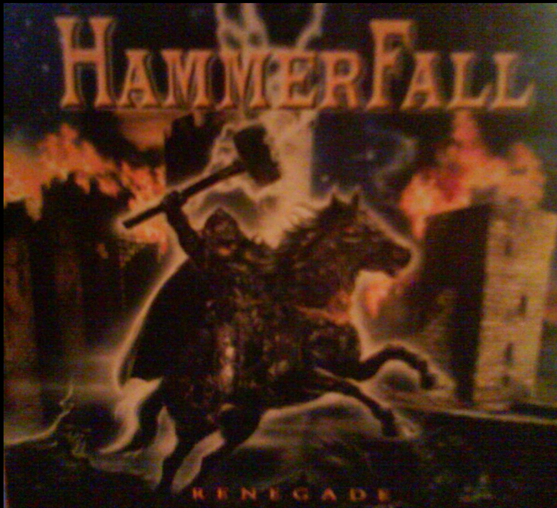
HammerFall – «Renegade»