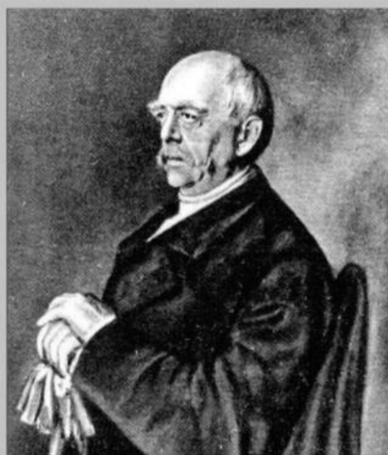
Отто фон Бисмарк