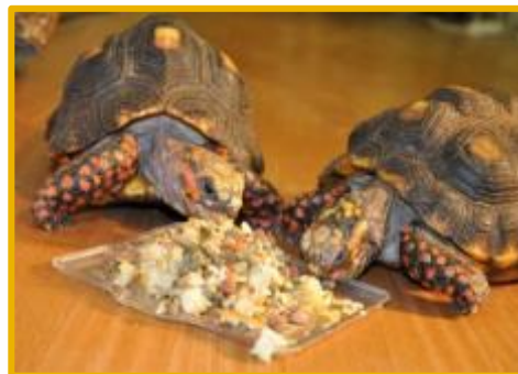
Земноводные и пресмыкающиеся