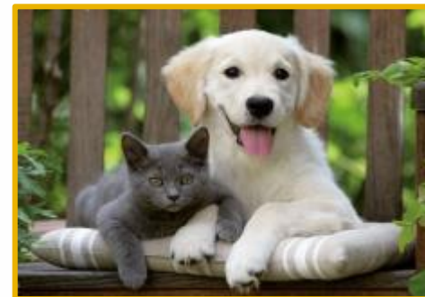
Кошки и собаки