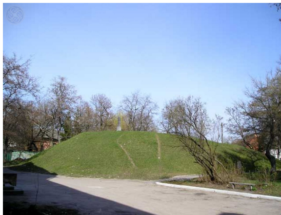
Курган Черная могила