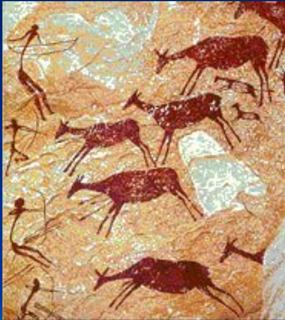
Сражающиеся лучники. Из пещеры Кастильон, Испания.