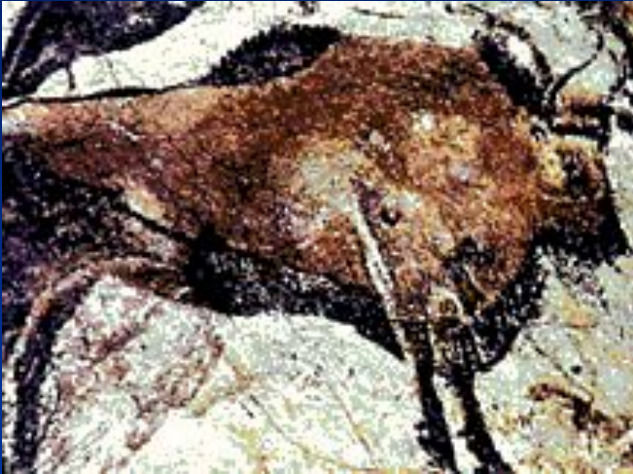
«Большой черный бык». Роспись пещеры Ласко. Франция. Примерно 14 век до н. э.