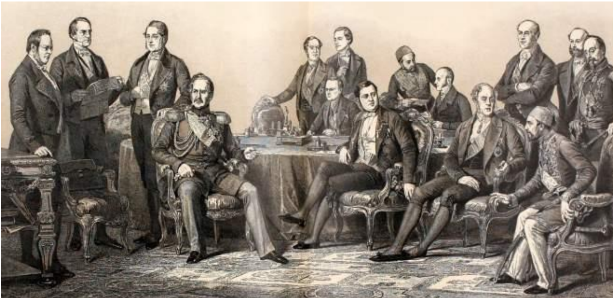
Парижский конгресс 1856 г. А.Бланшар