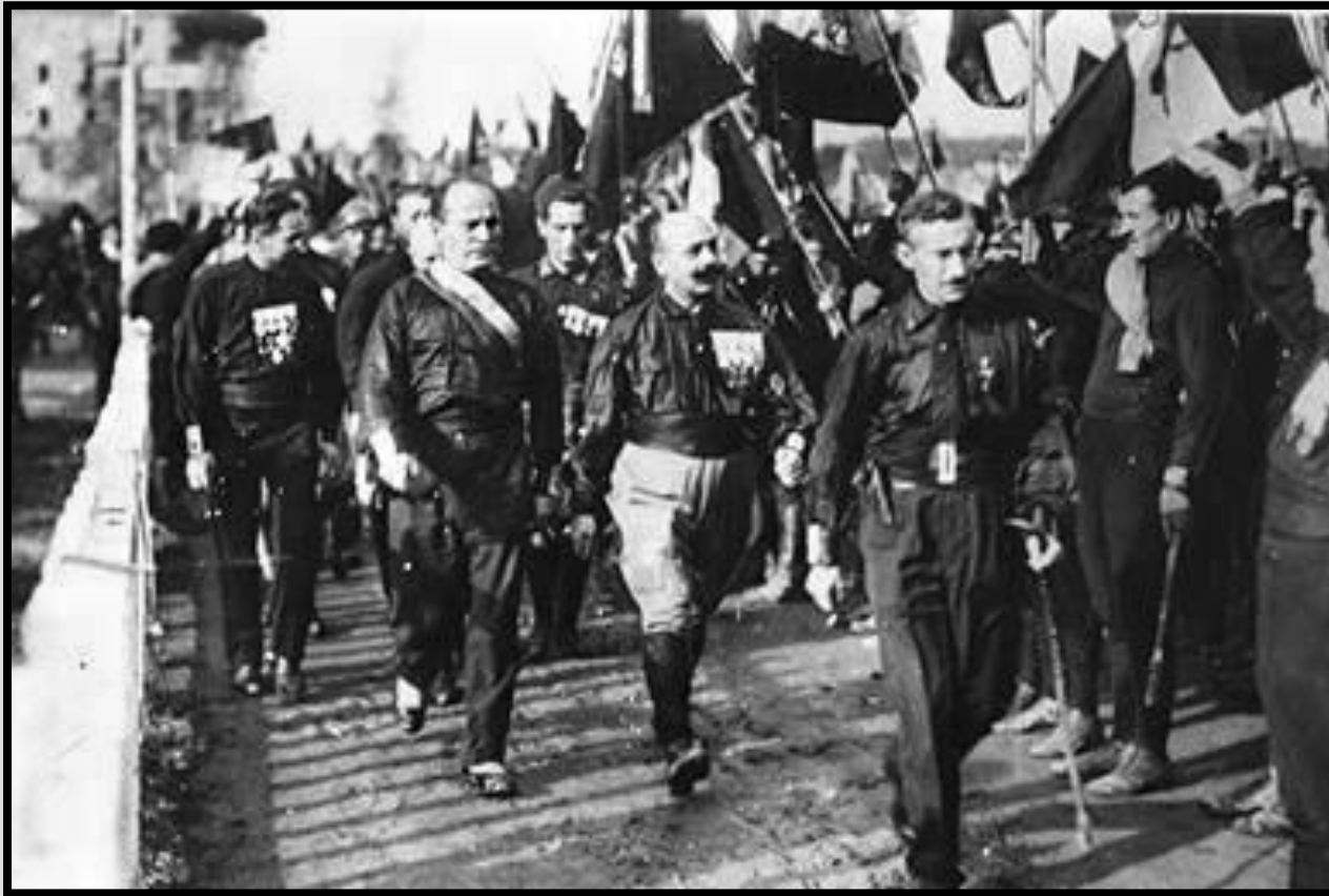
Муссолини и чернорубашечники во время Марша на Рим в 1922 году

На путь решительной борьбы против фашизма встала оформившаяся в январе 1921 г. коммунистическая партия Италии. В них вступали антифашисты независимо от классовой и политической принадлежности. Однако эта зародышевая форма единого антифашистского фронта не привела к единству даже в рабочем движении.