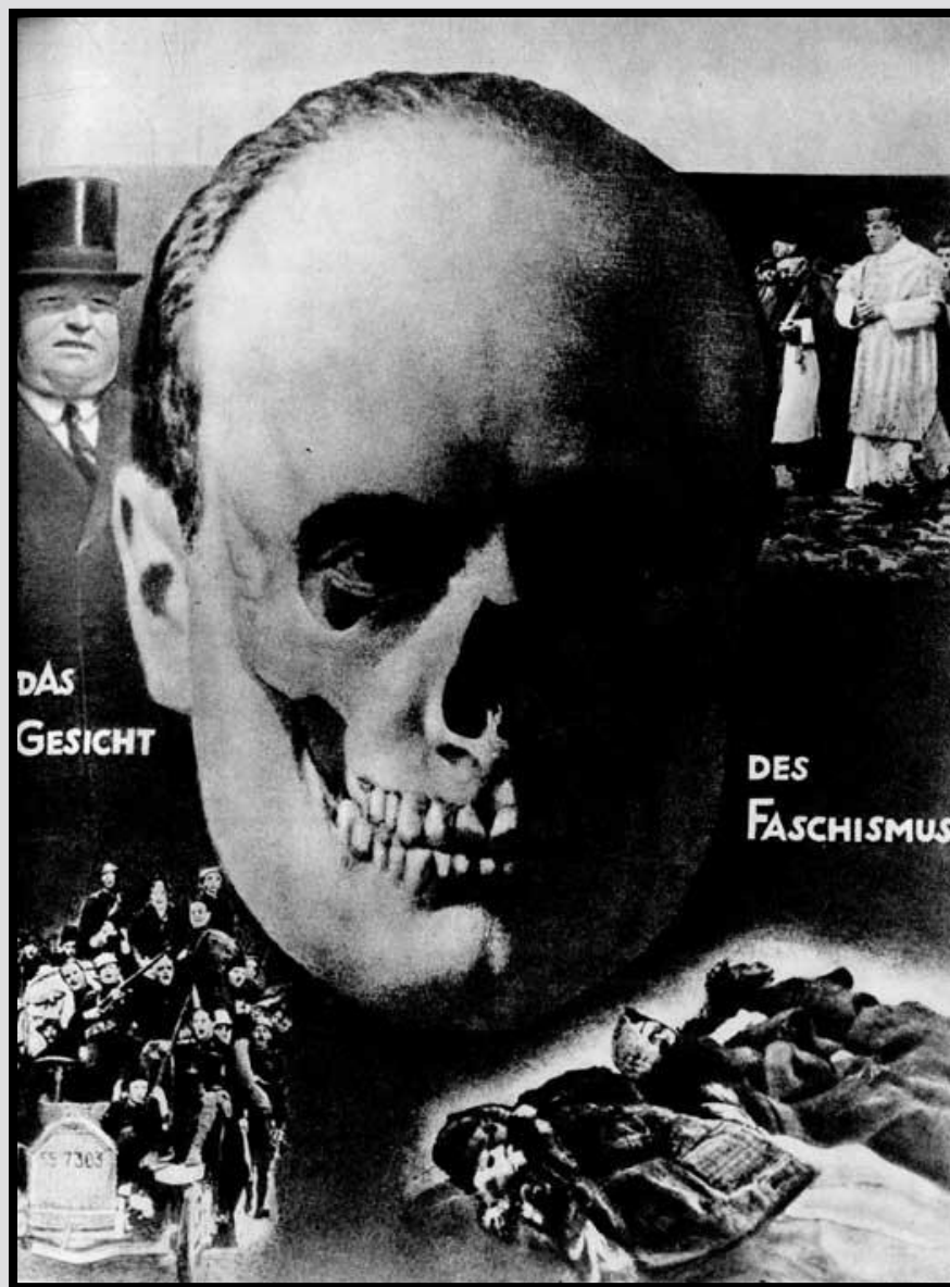
'Лицо фашизма' Фотомонтаж художника Д. Хартфильда. 1928 г.

Стремление монополистов к сохранению своего классового господства любой ценой сказалось в том, что они поспешили заблаговременно организовать силы, которые смогли бы не допустить новой вспышки революционной борьбы, осуществить превентивную контрреволюцию и, более того, использовать нараставший революционный гнев народа в своих классовых целях. Такой силой стал фашизм - выразитель интересов самых агрессивных кругов монополистической буржуазии, орудие в ее руках в борьбе с пролетариатом, трудящимися массами и прогрессивной интеллигенцией.