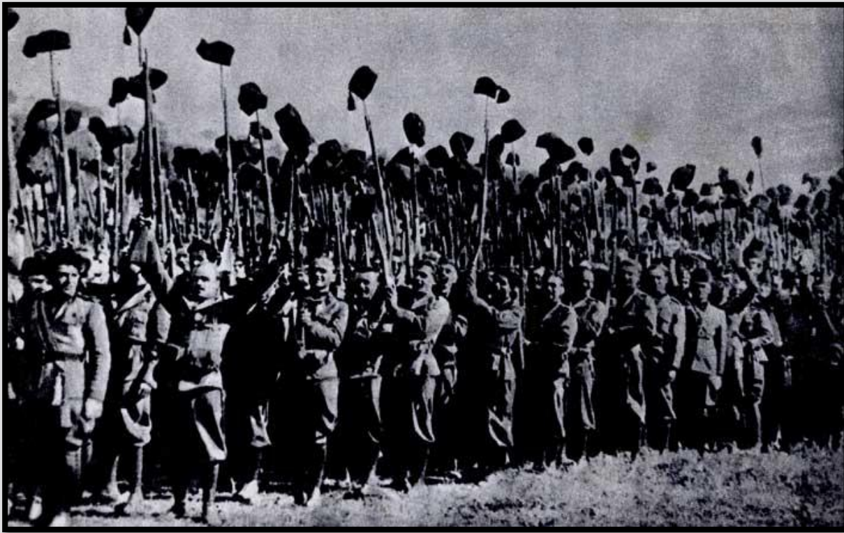
Отряд итальянской фашистской милиции

Сразу же после переворота, несмотря на сохранение парламентских форм, появились два новых государственных института: в декабре 1922 г. "Большой фашистский совет" (БФС) и в январе 1923 г. "Добровольная милиция национальной безопасности" (ДМНБ). БФС был организован на базе дирекции фашистской партии с добавлением к ней министров-фашистов и некоторых фашистских лидеров, назначенных лично Муссолини, ставшим председателем БФС. Этот совет контролировал законопроекты перед внесением их в парламент, деятельность самого правительства. Созданием ДМНБ Муссолини стремился добиться преобладания исполнительной власти в лице фашистского правительства над законодательной в лице короля и парламента. Передача ДМНБ в подчинение Муссолини усиливала его личную власть.