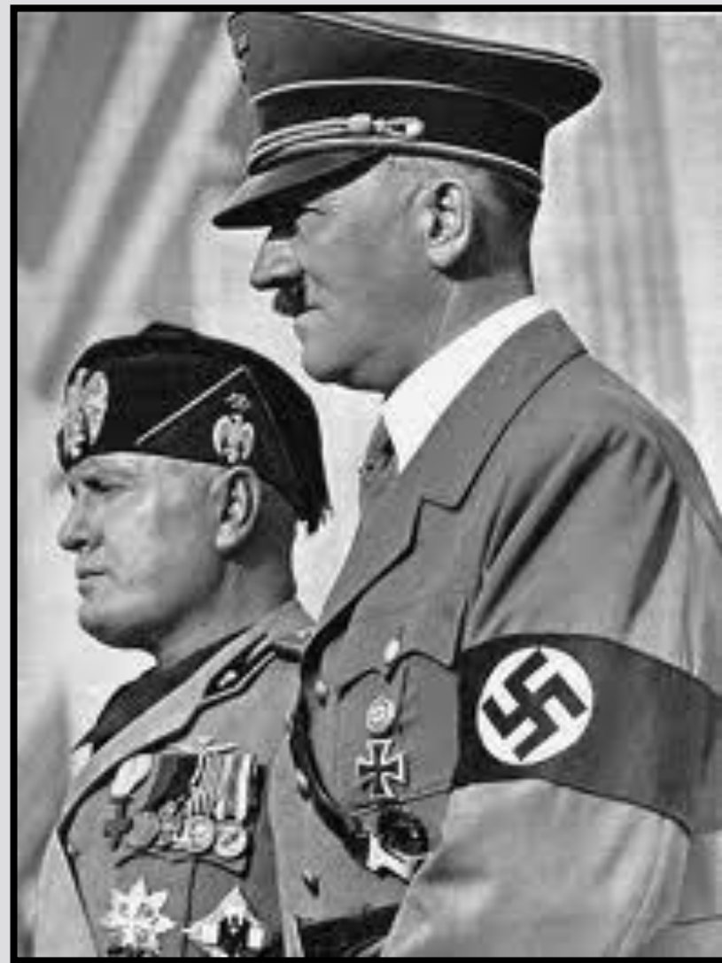
Муссолини и Гитлер

В январе 1925 г. Муссолини заявил о своем твердом намерении силой обуздать всякую оппозицию. Это был сигнал к началу нового фашистского наступления, направленного на ликвидацию остатков буржуазно-демократических свобод. В июне на съезде фашистской партии Муссолини провозгласил стремление фашизма трансформировать моральное и политическое сознание итальянцев в сознание монолитное и тоталитарное: "Мы хотим фашизировать нацию... Фашизм должен стать образом жизни... должны быть итальянцы эпохи фашизма, как были, например, итальянцы эпохи Возрождения". Здесь же было впервые объявлено о стремлении фашизма к созданию империи.