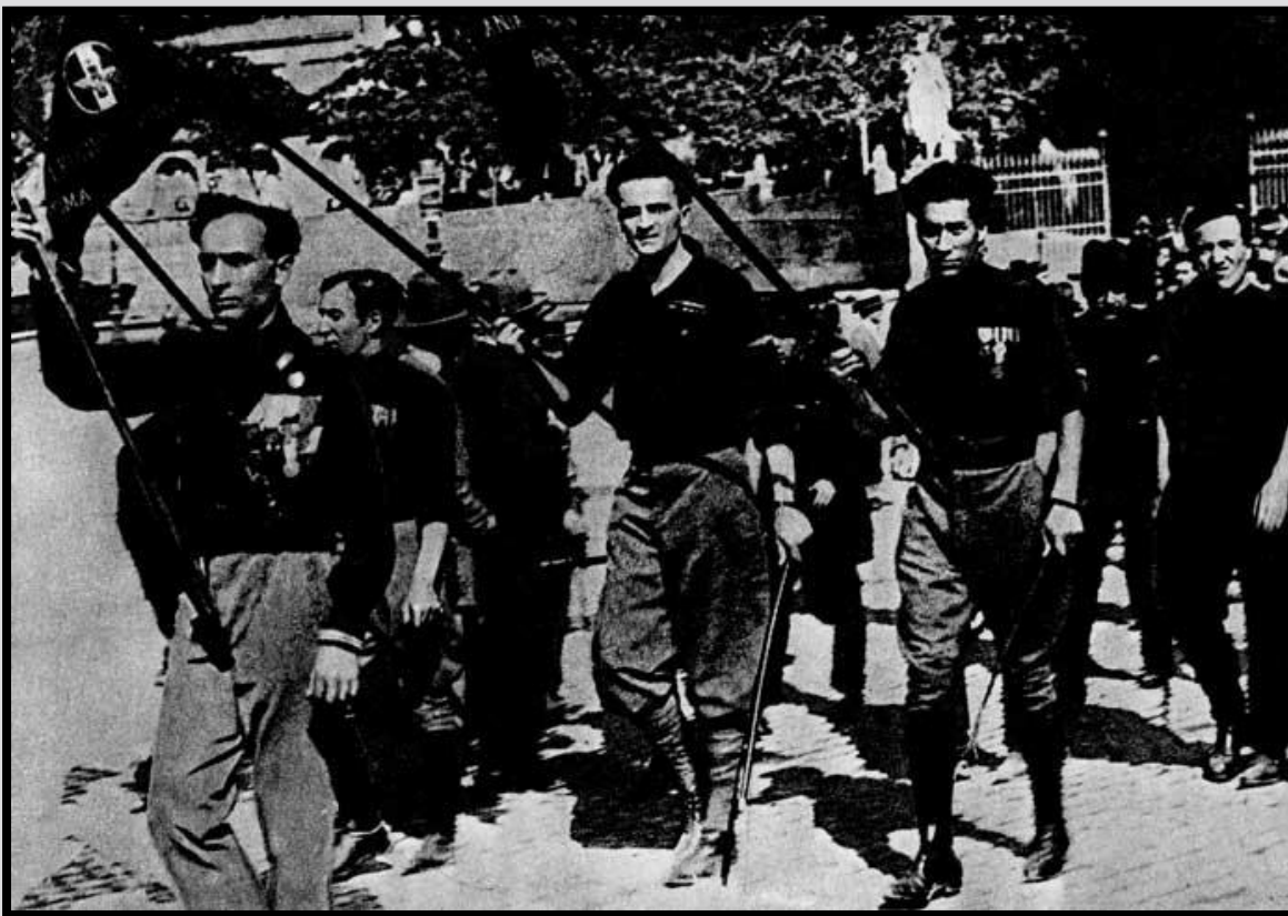
Фашистский отряд чернорубашечников отправляется на избиение рабочих. Рим. 1923 г.

Неорганизованному антифашистскому фронту противостояла партия фашистов с ее вооруженными отрядами чернорубашечников, пользовавшимися всемерной поддержкой буржуазно-демократического правительства, военных властей, полиции, суда и крупной буржуазии. Рабочих и крестьян разоружали, а фашисты открыто носили оружие. Полиция в лучшем случае оставалась пассивной, чаще же прямо поддерживала фашистов. Суды выносили суровые приговоры рабочим, подвергавшимся нападению чернорубашечников, которых оправдывали