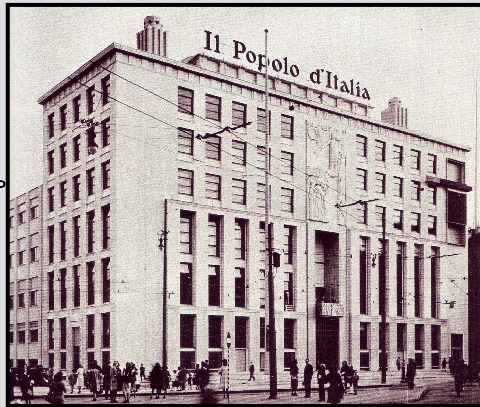
Издательство газеты «IL popolo d'Italia»

Организатором первых фашистских отрядов, а затем вождем фашистского движения в Италии стал Б. Муссолини. Исключенный в начале первой мировой войны из социалистической партии, он был одним из лидеров движения за вступление Италии в войну. Муссолини основал свою газету "Народ Италии" ("Popolo d'Italia"), страницы которой в годы первой мировой войны заполнялись крикливой милитаристской пропагандой. "Нейтральные не двигают событиями, а подчиняются им. Только кровь дает бег звенящему колесу истории» Такое же сочетание яростного национализма с социальной демагогией было характерно и для деятельности фашистской организации, созданной Муссолини в марте 1919 г., под названием "Союз борьбы" ("Fascio di combattimento") 2 . Вначале организация насчитывала всего несколько десятков человек, но постепенно стала расширять свои ряды, главным образом за счет бывших фронтовиков.