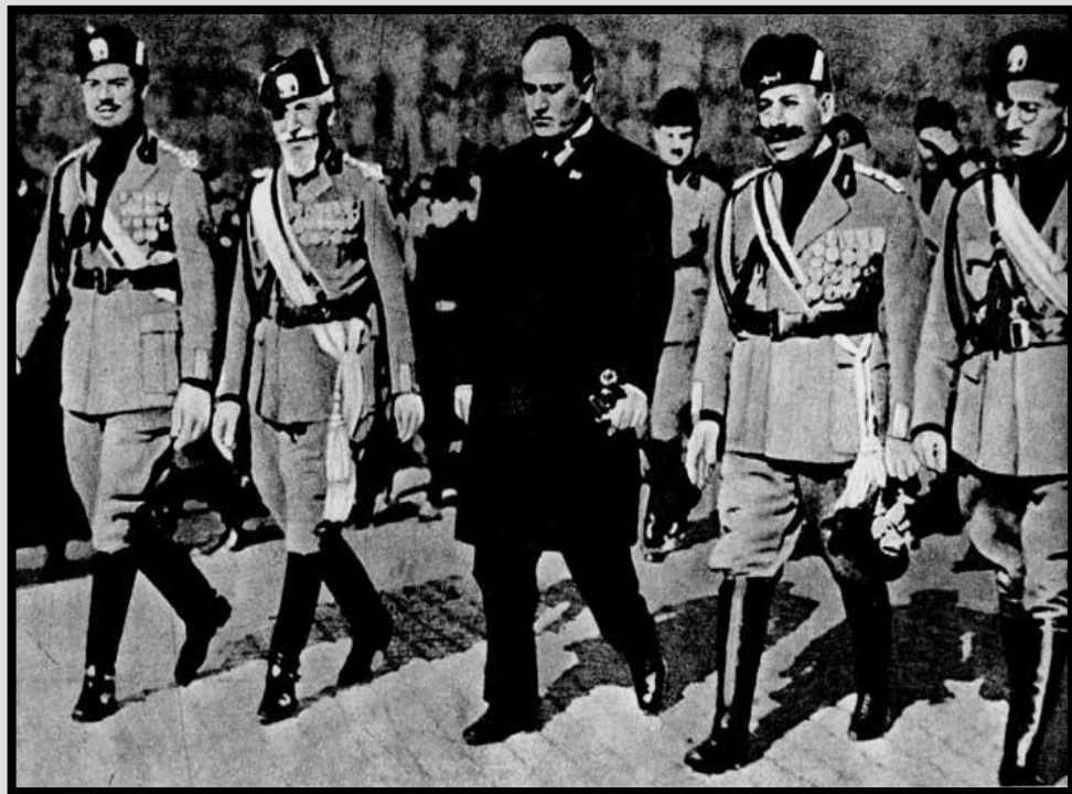
'Поход на Рим' итальянских фашистов во главе с Муссолини. 1922 г.

Однако никаких мер, чтобы остановить фашистов на пути к захвату власти, правительство не предприняло. Да и трудно было ожидать этого после того, как в течение почти двух лет сменявшие друг друга "либеральные" и "демократические" правительства Италии потворствовали и помогали фашистам. Открытая передача власти в руки фашизма произошла в 1922 г. 28 октября был совершен фашистский переворот, названный Муссолини "великим походом на Рим". Этим дуче хотел создать видимость того, что фашистским отрядам пришлось сломить противостоявшие им вооруженные силы.