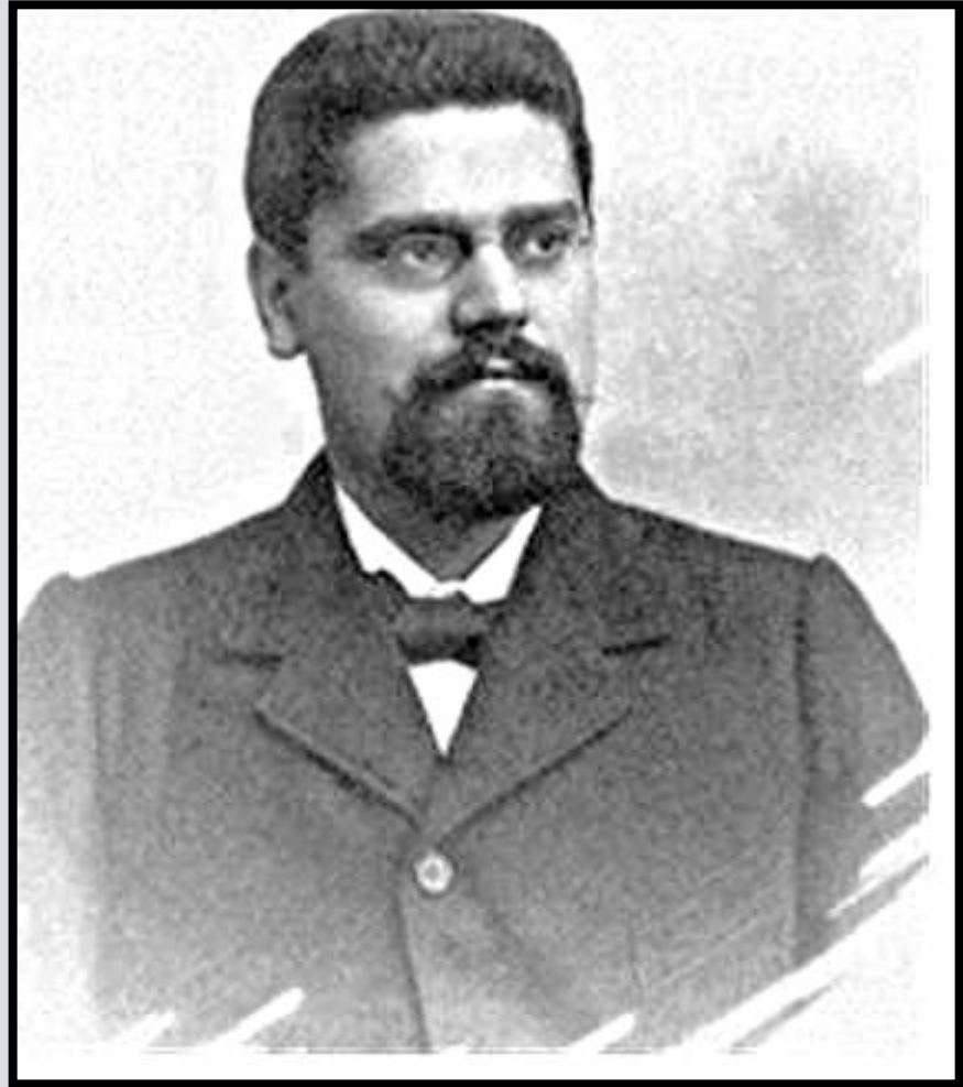
Философ Джованни Джентиле — один из отцов итальянского фашизма

После фашистского переворота коммунисты и социалисты организовали отдельные выступления трудящихся, главным образом забастовки. Обострение политической ситуации произошло летом 1924 г. Депутаты оппозиционных партий вышли из парламента и образовали так называемый "Авентинский блок". Компартия предлагала либерально-демократическим и социалистическим руководителям блока объединиться и начать борьбу с фашизмом.