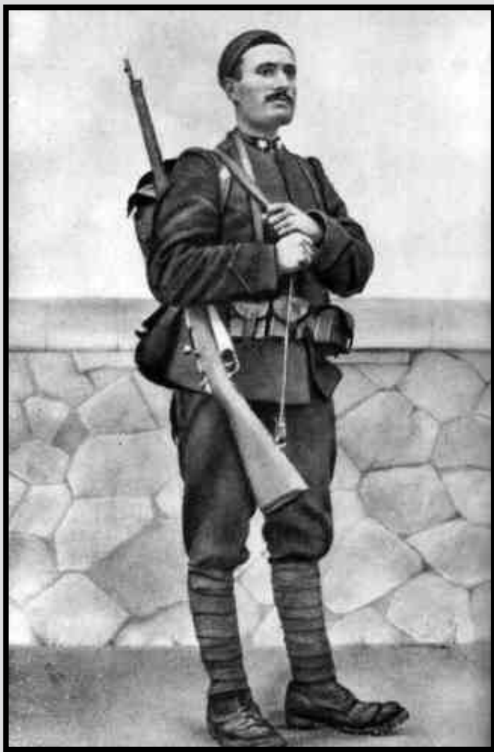
Муссолини в итальянской военной форме, 1917 г.

Но итальянская социалистическая партия и Всеобщая конфедерация труда не обнаружили в то время достаточной революционности и решительности, не возглавили движение. А господствовавшие в партии центристы, испугавшись размаха и характера борьбы, не встали во главе масс.