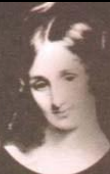
Мэри Шелли — английская писательница, родо- начальница литературы ужасов