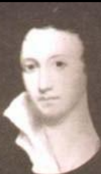
Перси Биши Шелли — великий английский поэт