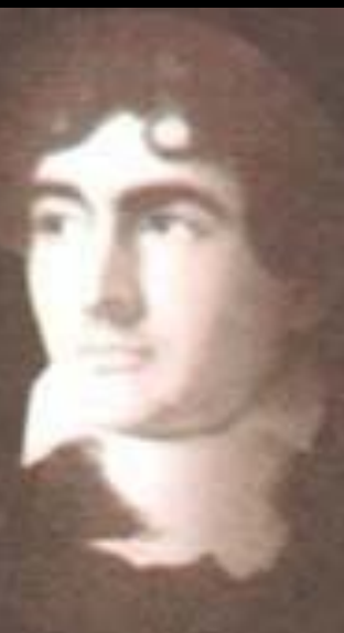
Джон Полидори — английский врач, «отец» вампиров в европейской литературе