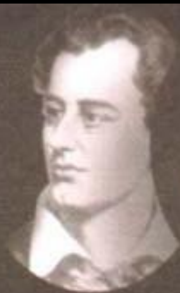
Джордж Гордон Байрон — великий английский поэт