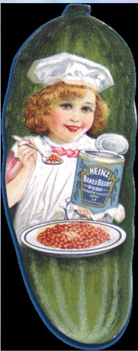
Закладки использовали как рекламу