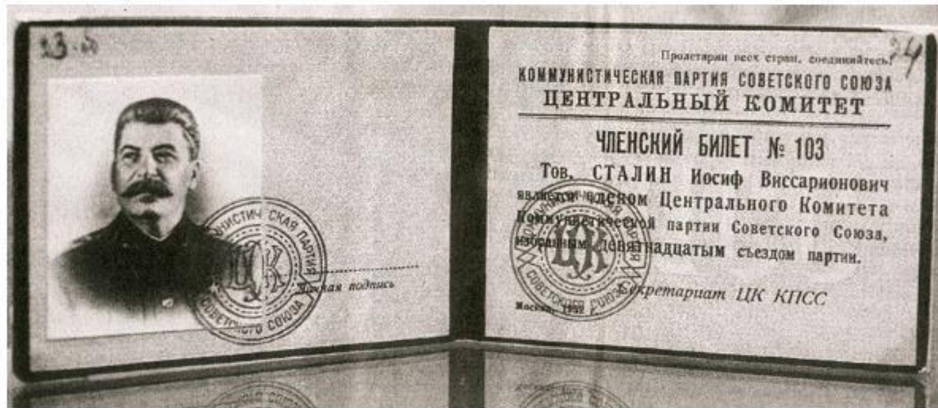
Билет члена ЦК КПСС № 103 И. В. Сталина. 1952