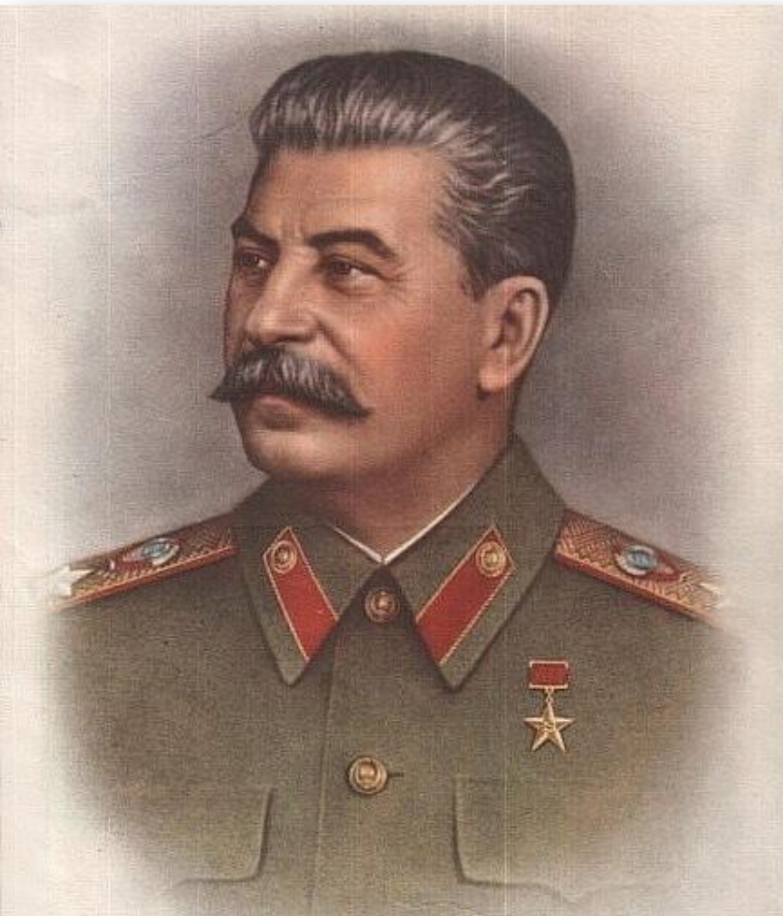
Иосиф Виссарионович Сталин