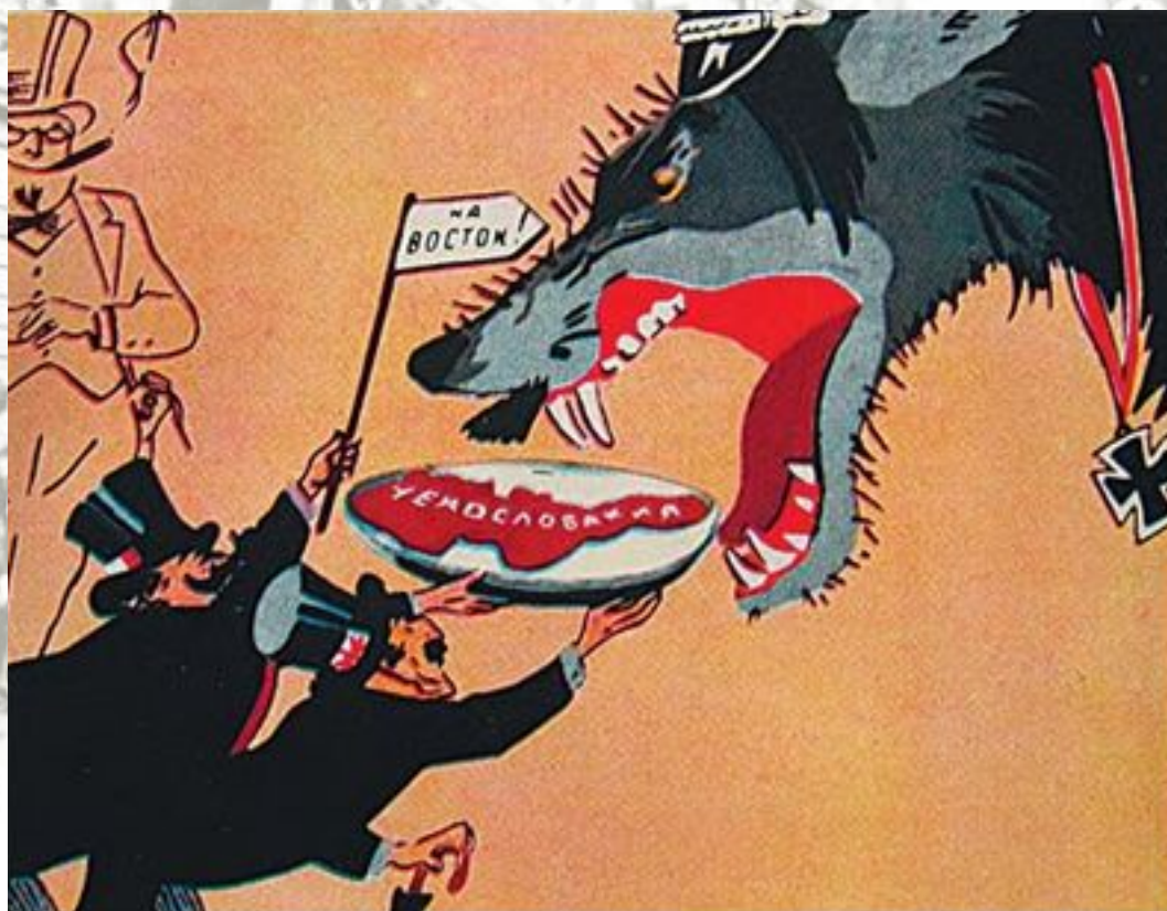
19. Oktober 1938

15 марта 1939 года гитлеровцами была оккупирована вся Чехословакия, которая с этого момента перестала существовать как самостоятельное государство