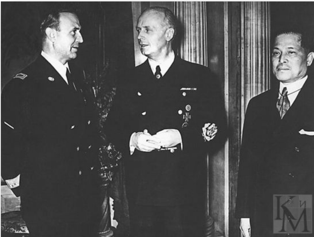
Министры иностранных дел стран «Антикоминтерновского пакта». Слева направо: Г. Чиано (Италия), И. Риббентроп (Германия), Х. Осима (Япония).