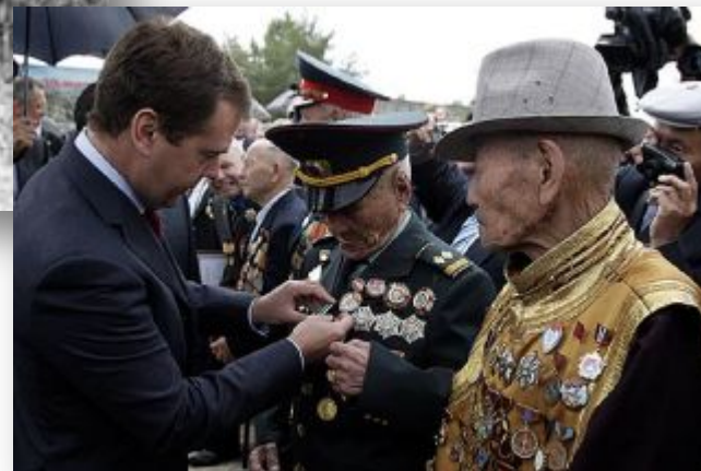
Д. А. Медведев вручает российские награды ветеранам Халхин-Гола (Улан-Батор, 2009)