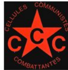
Communist Combatant Cells