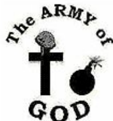
The Army of God