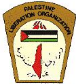
Palestine Liberation Organization