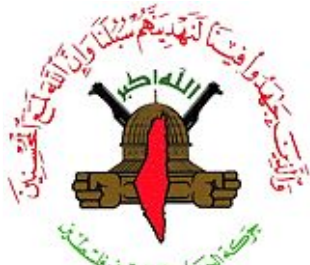
Islamic Jihad Movement in Palestine