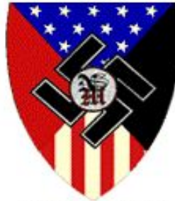
National Socialist Movement