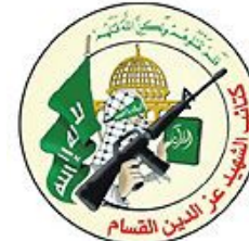
Ezzedeem al-Qassam Brigades