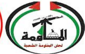
Popular Resistance Committees