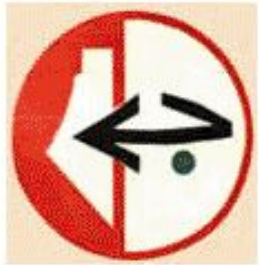
PFLP Martyr Abu Ali Mustafa Battalions