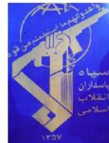
Army of the Guardians of the Islamic Revolution