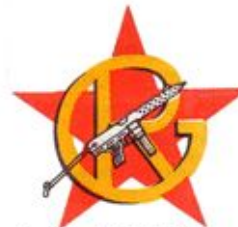
Antifascist Resistance Groups October First (GRAPO)