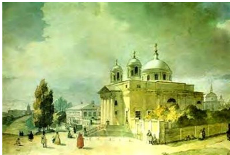
Почаївська лавра з заходу