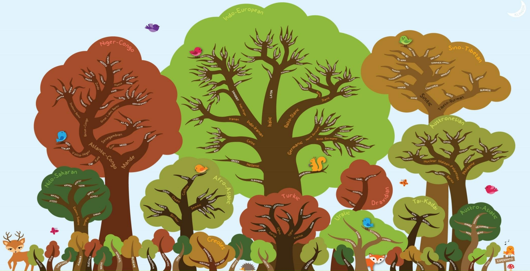
World Language Families