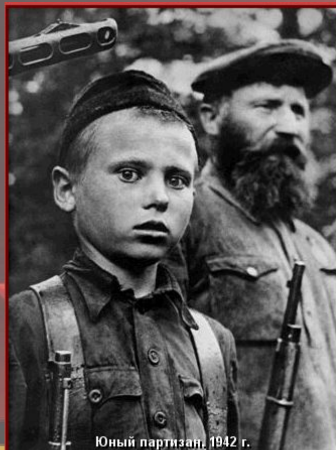
Юный партизан, 1942 г.

В серьезной степени героизм солдат и командиров сорвал планы немецкого наступления. Уже летом 41-го года были полностью сорваны планы наступления немецкой армии. Потом были Сталинград, Курск, Московская битва, но все они стали возможны благодаря беспримерному мужеству простого советского солдата.