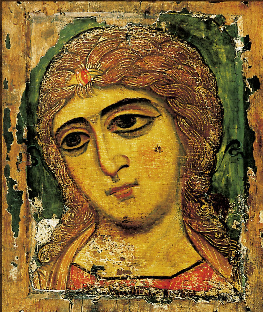
Ікона «Ангел – золоте волосся»

У XII ст. у зв'язку з постійною зовнішньою загрозою навали кочовиків особливо актуальними в живописі були ідеали військової доблесті. Поширення набули ікони «Георгія Воїна», «Дмитра Солунського», «Ангела — золоте волосся».