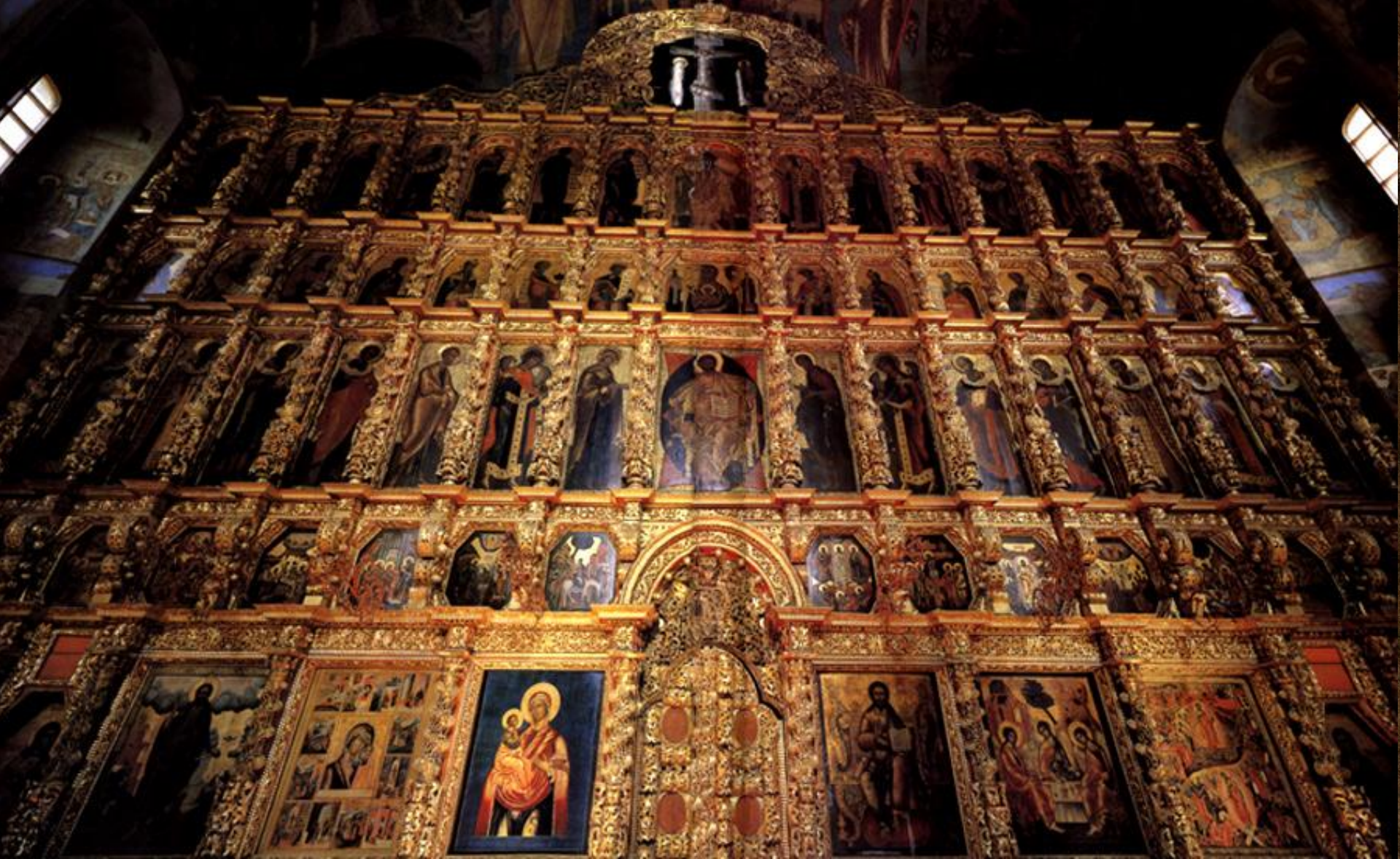
Іконостас Троїцького собору