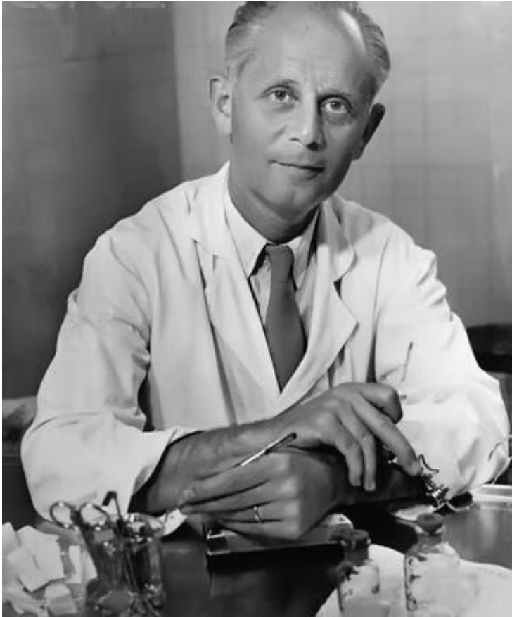
Ганс Селье (1907-1982)

Стресс (от англ. stress — напряжение) — это состояние психического напряжения, обусловленное выполнением деятельности в особенно сложных условиях. Автором концепции стресса является Ганс Селье (1907-1982). Понятие «стресс» им было введено в 1936 г. при описании адаптационного синдрома.