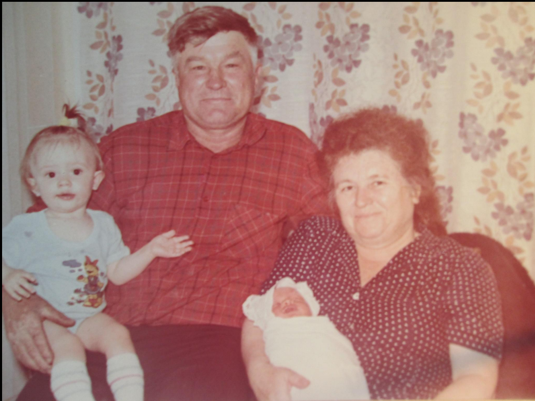
Местная религиозная организация христиан веры евангельской (пятидесятников) «Ярославская церковь «ПОБЕДА ХРИСТА» г. Ярославля