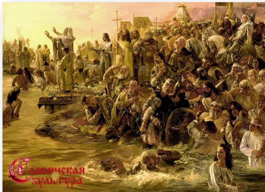
В. М. Назарук. «Крещение».