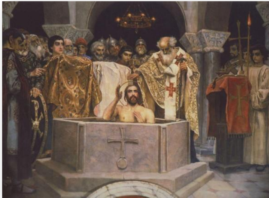
Виктор Васнецов. «Крещение князя Владимира».