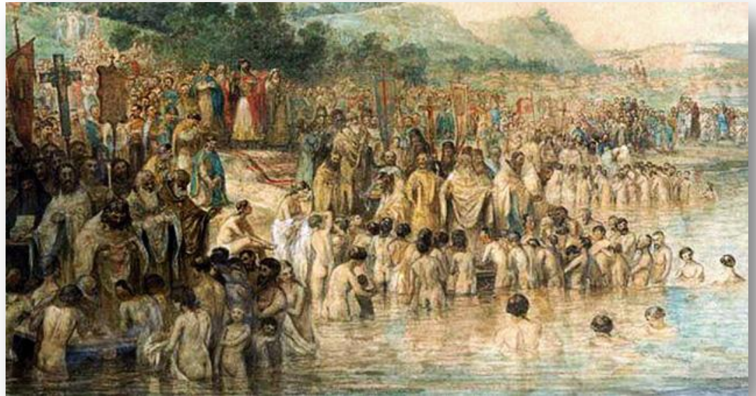
Василий Перов. «Крещение Руси».