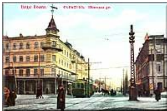
Гостиница Россия (угол ул. Горького)