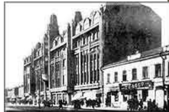
Гостиница Астория (сейчас – гостиница Волга)