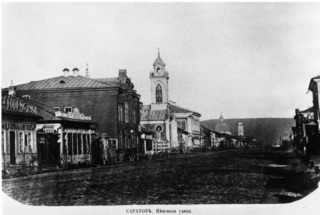
САРАТОВЪ. Нѣмецкая улица.

Мой рассказ – про одну из самых интересных улиц Саратова – улицу Немецкую , она же – проспект Кирова , она же « Саратовский Арбат »