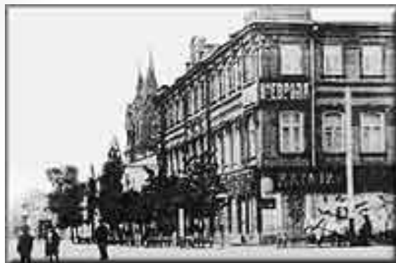
Гостиница Европа (угол ул. Вольской)