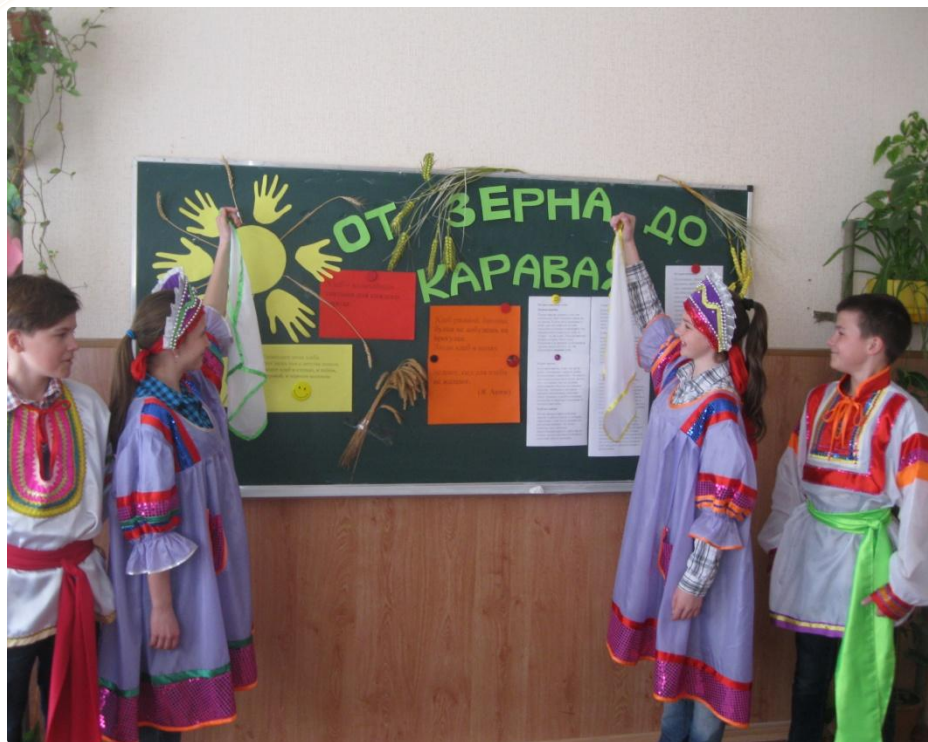
Презентация проекта учащимися 8 класса