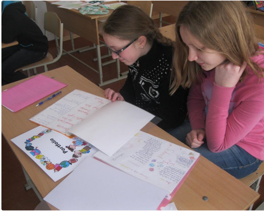
Разработка плана написания сказки