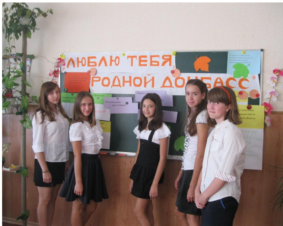
Первый урок , сентябрь- 2015