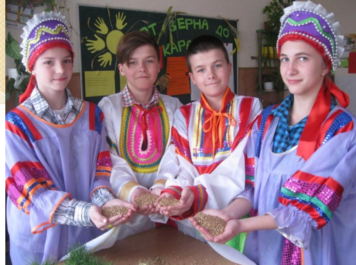
Проект «От зерна до каравая»