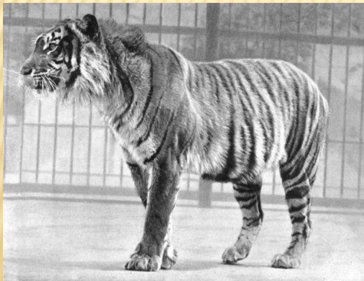
Яванский тигр (до 1993)