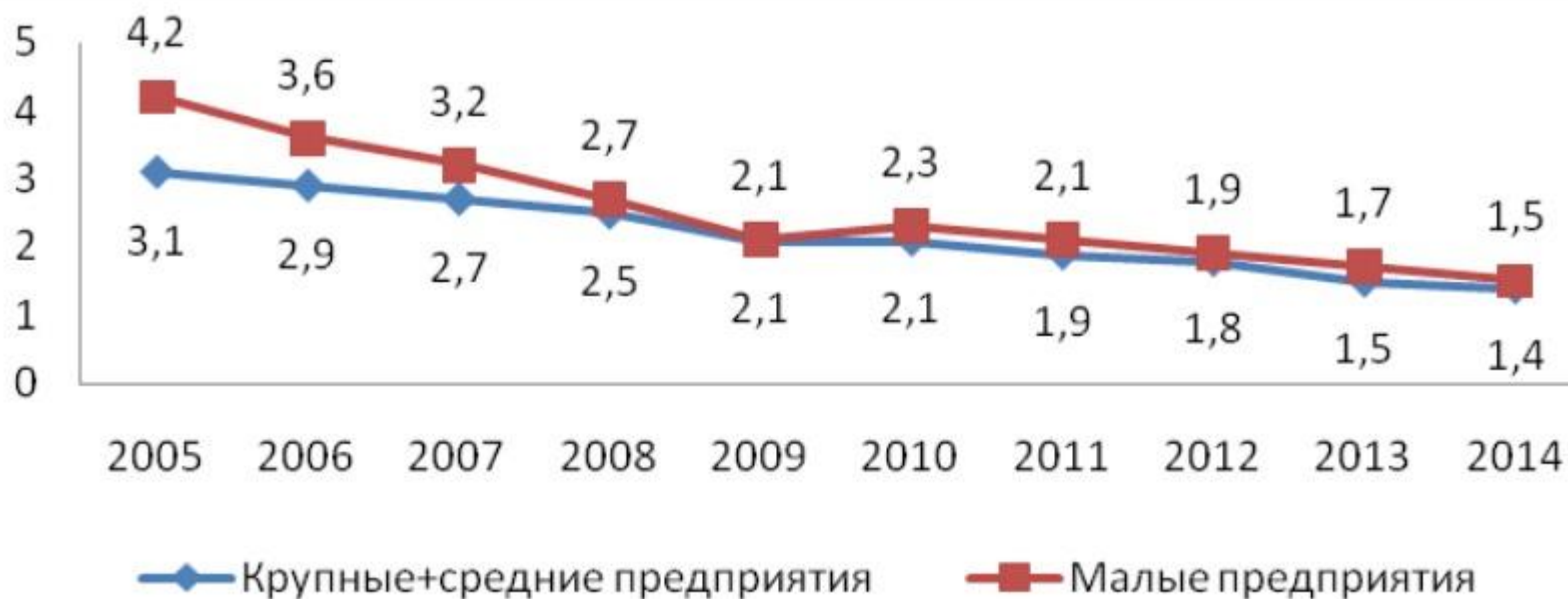
Рис. 1. - Динамика показателей общего травматизма в России за 2005- 2014 гг. (на 1000 работников)

В 2005 г. уровень производственного травматизма на малых предприятиях был почти в 1,5 раза выше, чем на крупных и средних. В последующие годы показатели снижались. В 2014 г. уровень травматизма на малых предприятиях по сравнению с крупными и средними практически не отличался*. Динамика показателей общего травматизма в России за 2005- 2014гг. приведена на рис. 1.