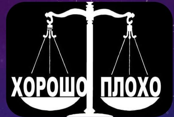
Нормы морали (нравственность и)