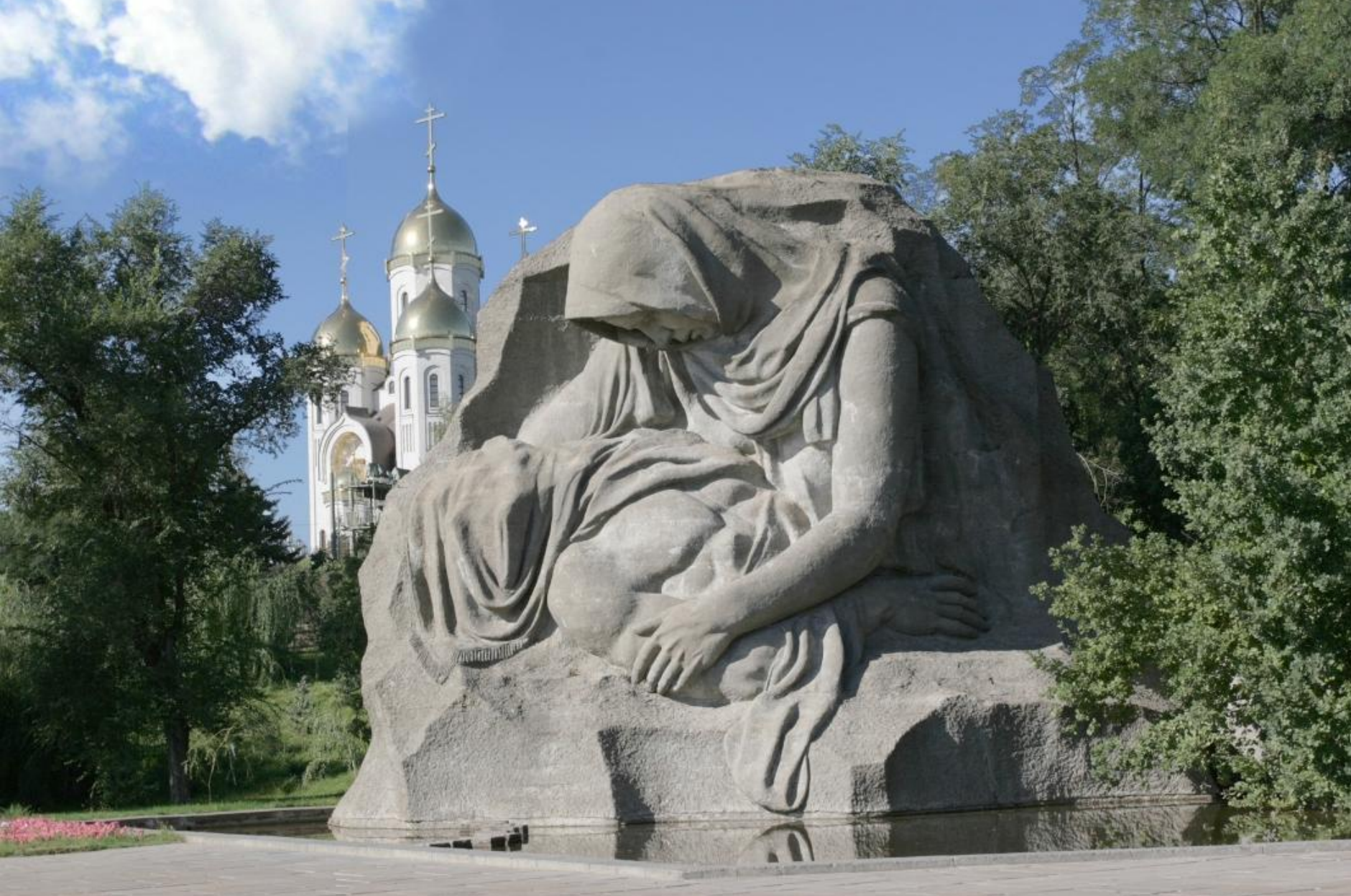
Композиция скорбящей матери с умершим воином на руках