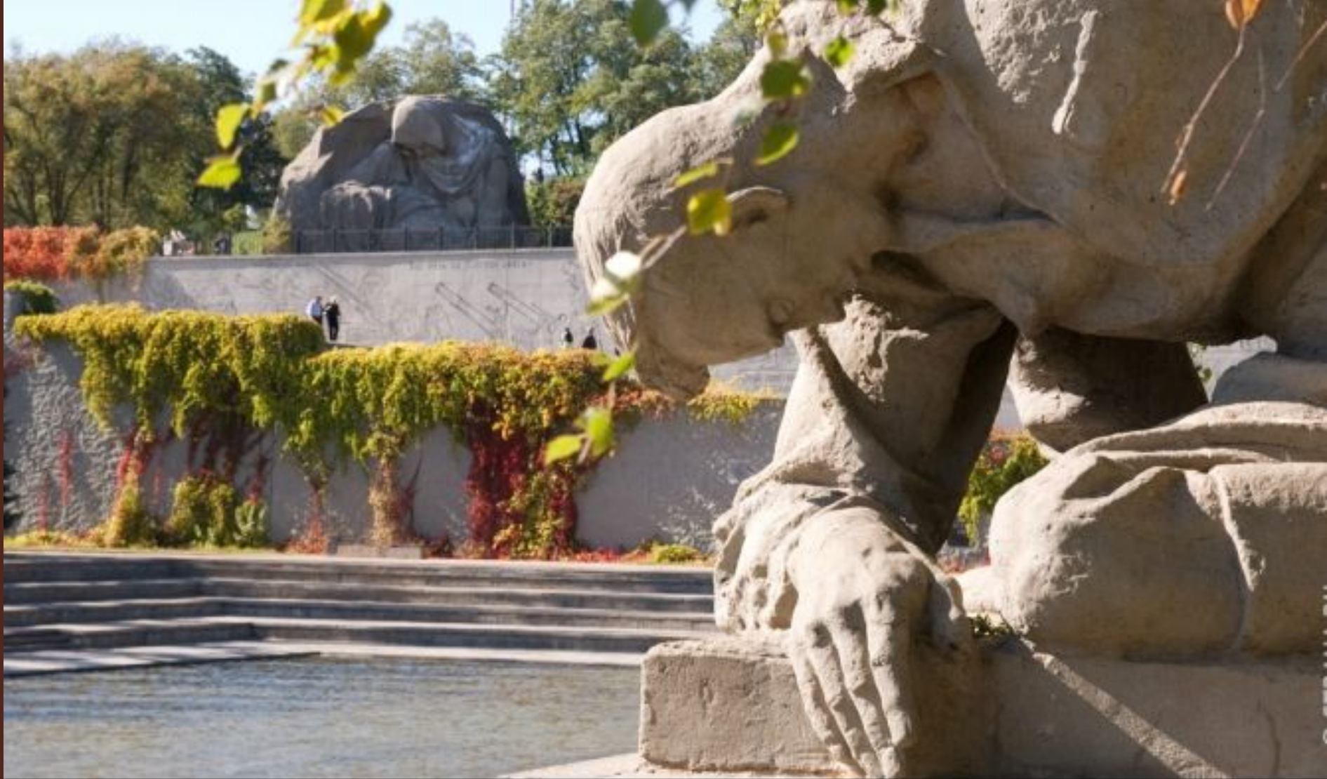
Волгоград. Мамаев курган. Фрагмент скульптурной композиции с раненым солдатом на фоне "Озера слез" и памятника "Скорбящая мать."