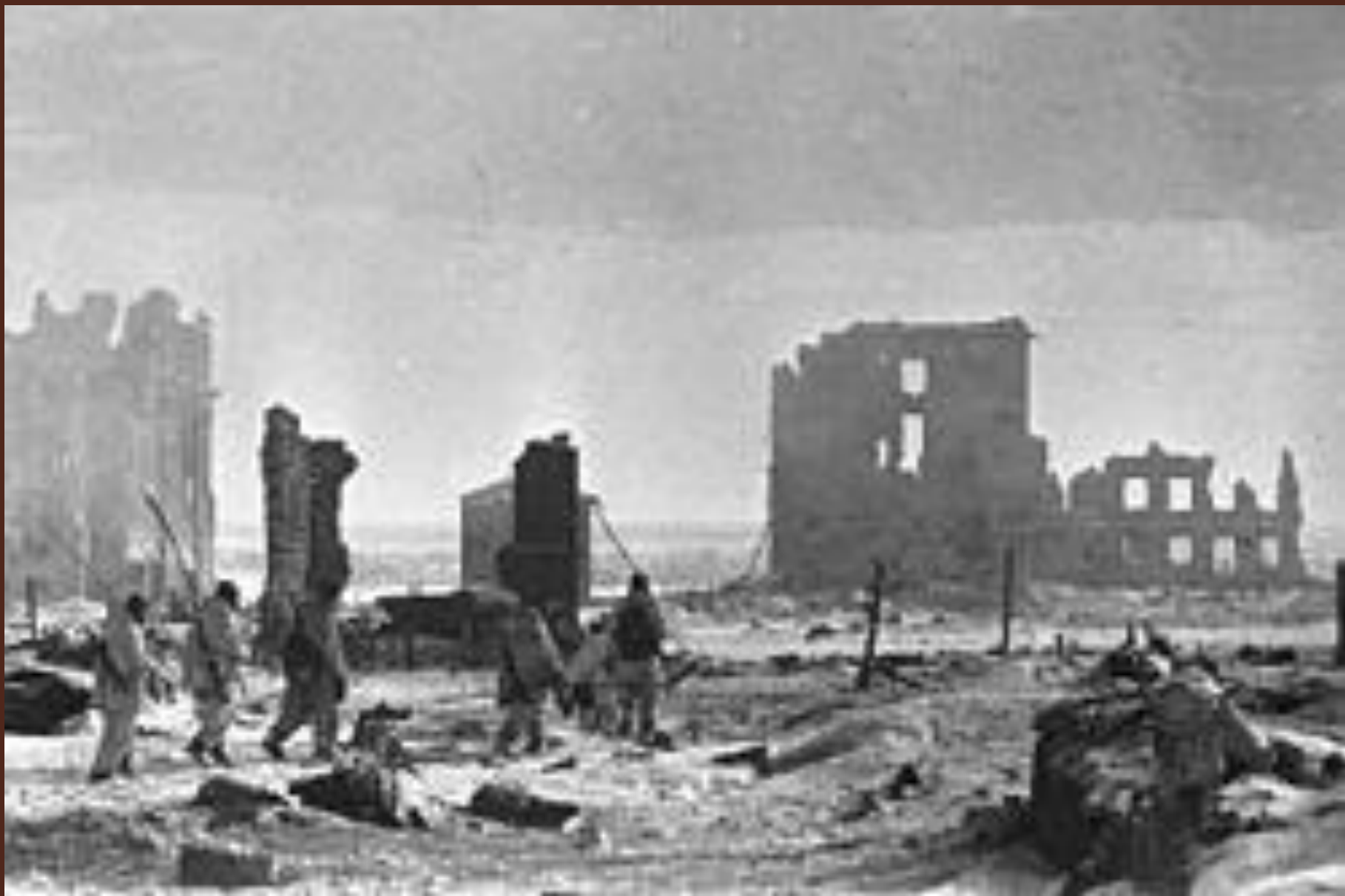
Центр города Сталинграда, 2 февраля 1943 года