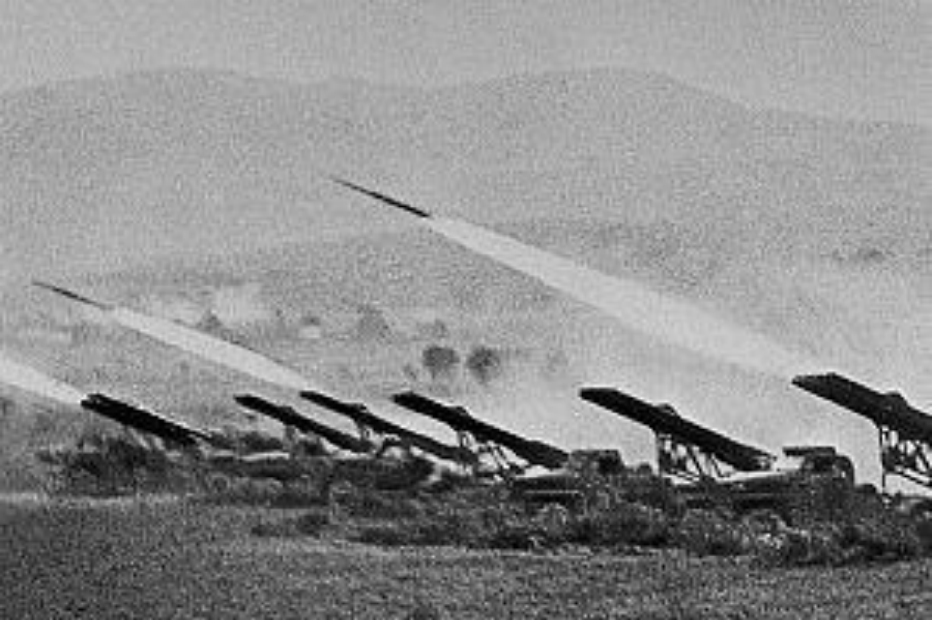
Артподготовка советского наступления