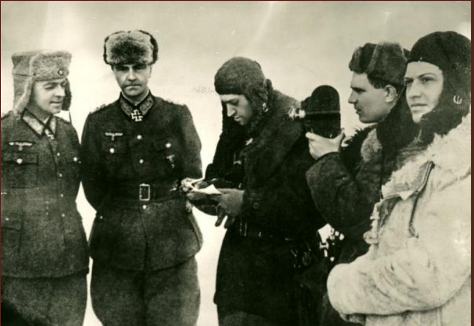
Сталинградская битва, фото плененного Ф. Паулюса