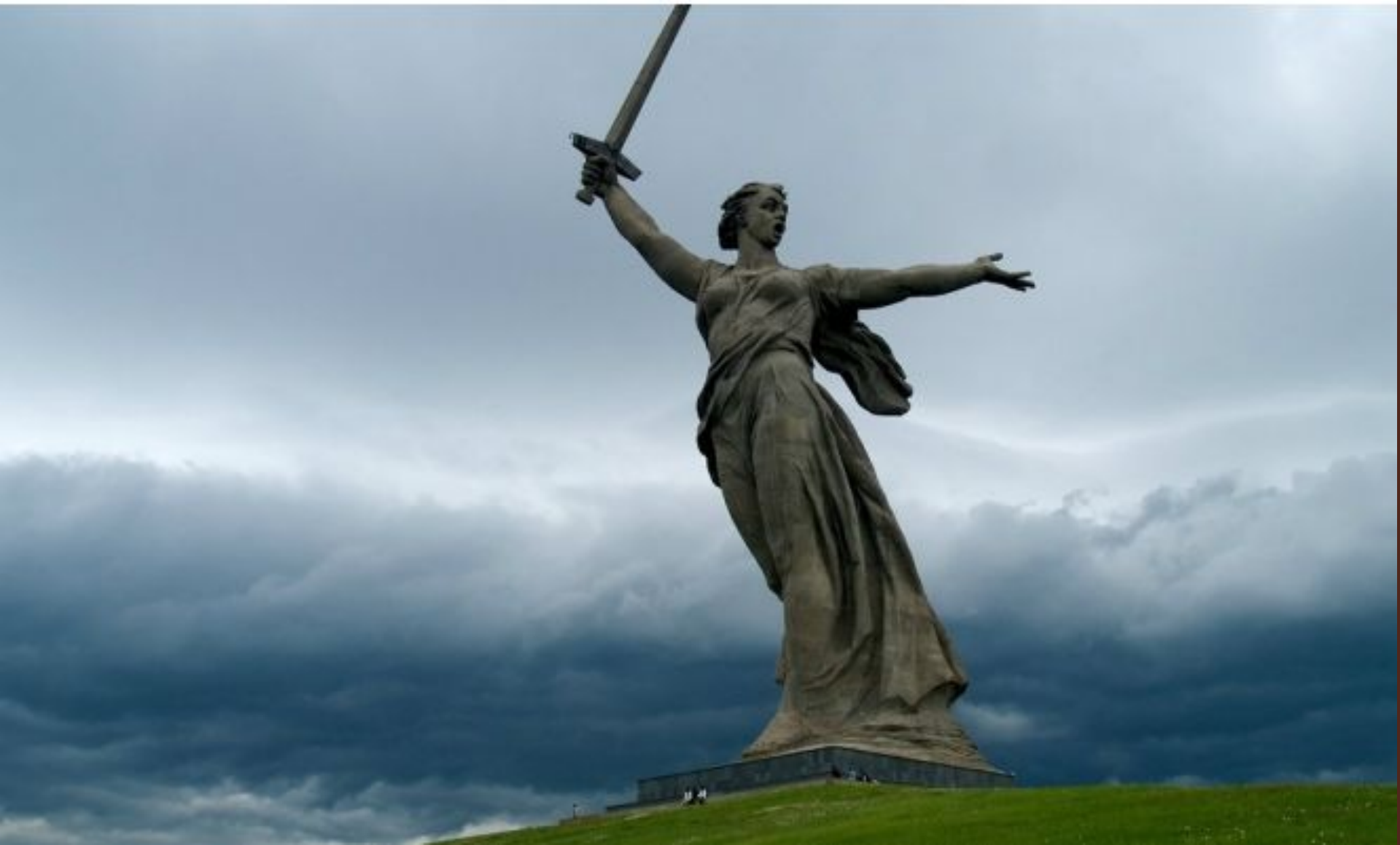
Волгоград. Мамаев курган. Скульптура «Родина-мать зовёт!»