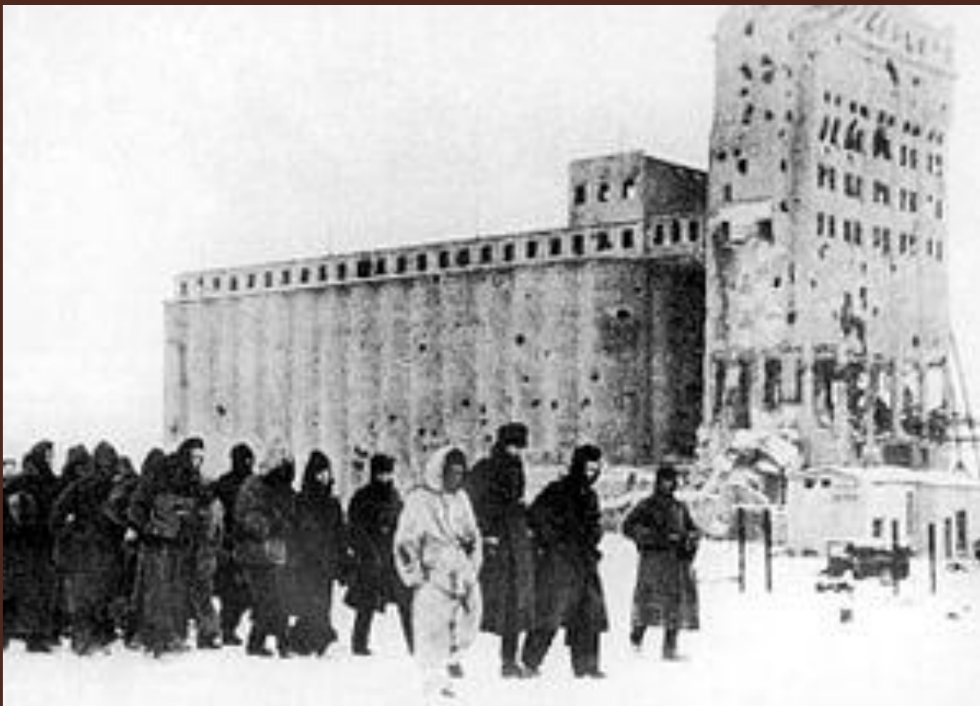
Пленённые под Сталинградом немецкие солдаты. Февраль. Позади — большое здание элеватора (генерал-фельдмаршал Паулюс лично разработал для своих солдат нашивку с изображением элеватора) 1943 года.