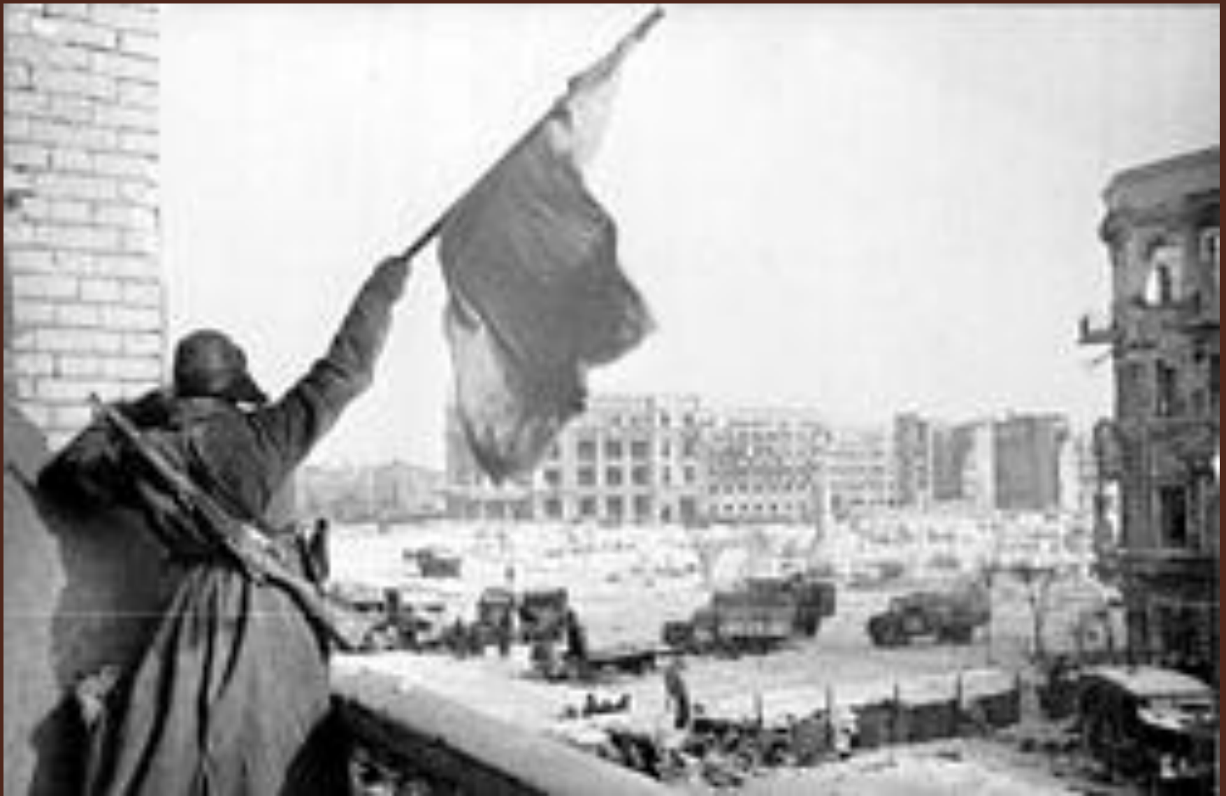
Флаг над освобождённым городом, Сталинград, 1943 год