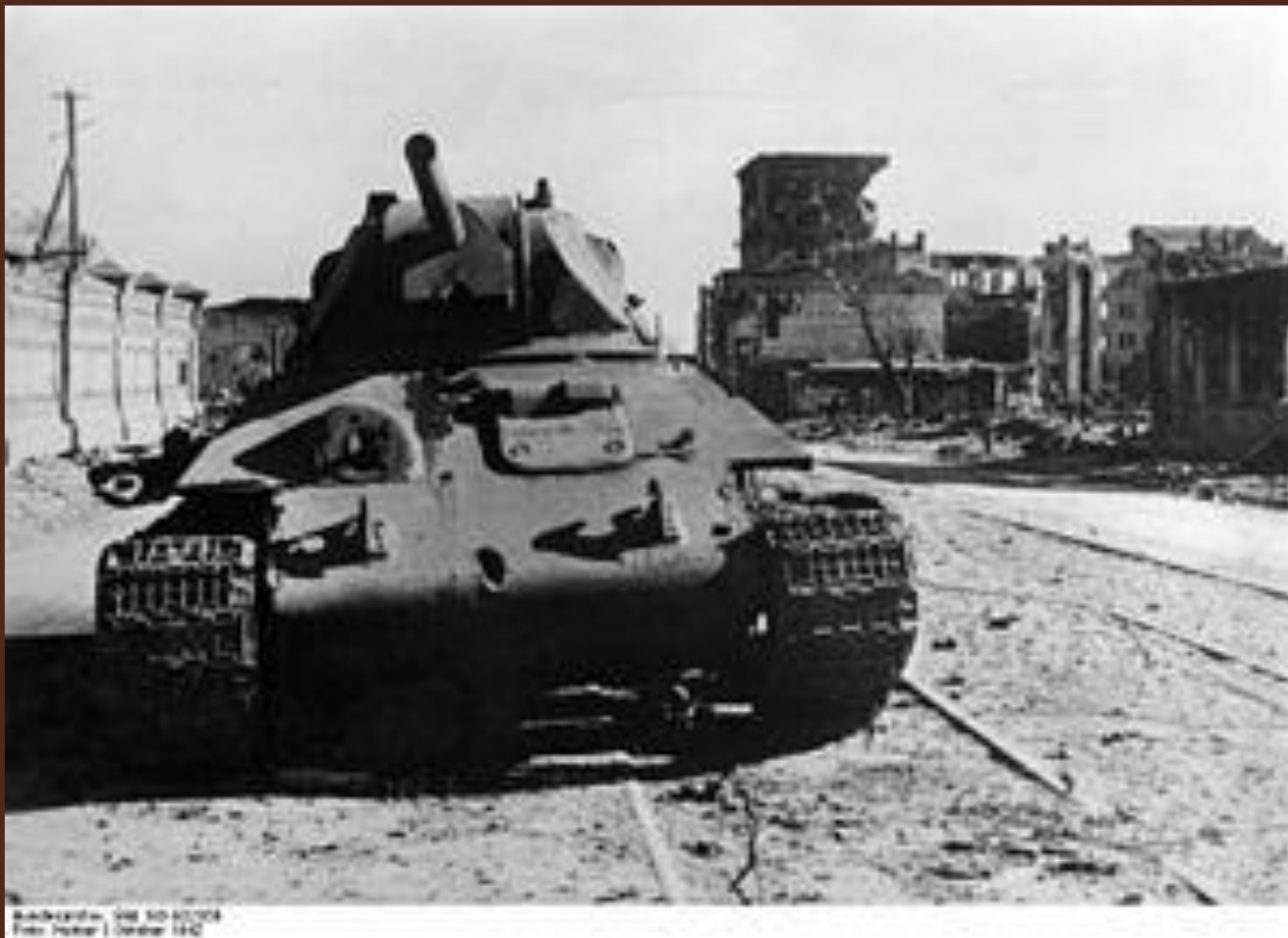
Подбитый советский танк Т-34 в Сталинграде, 8 октября 1942 года