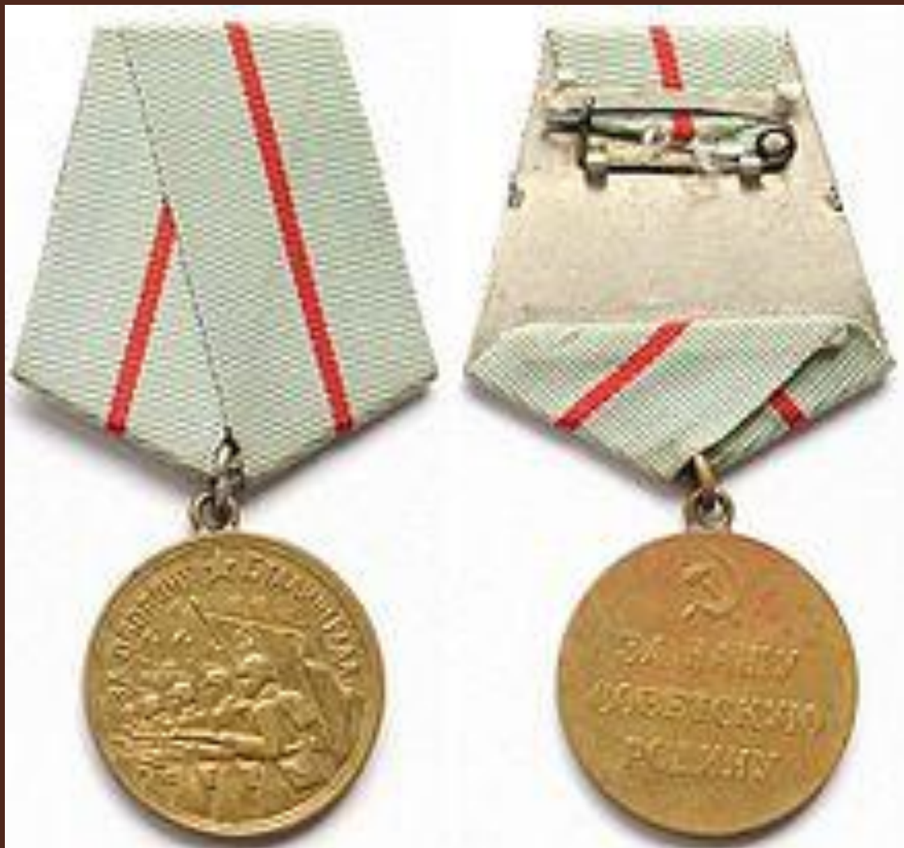
Медаль «За оборону Сталинграда»