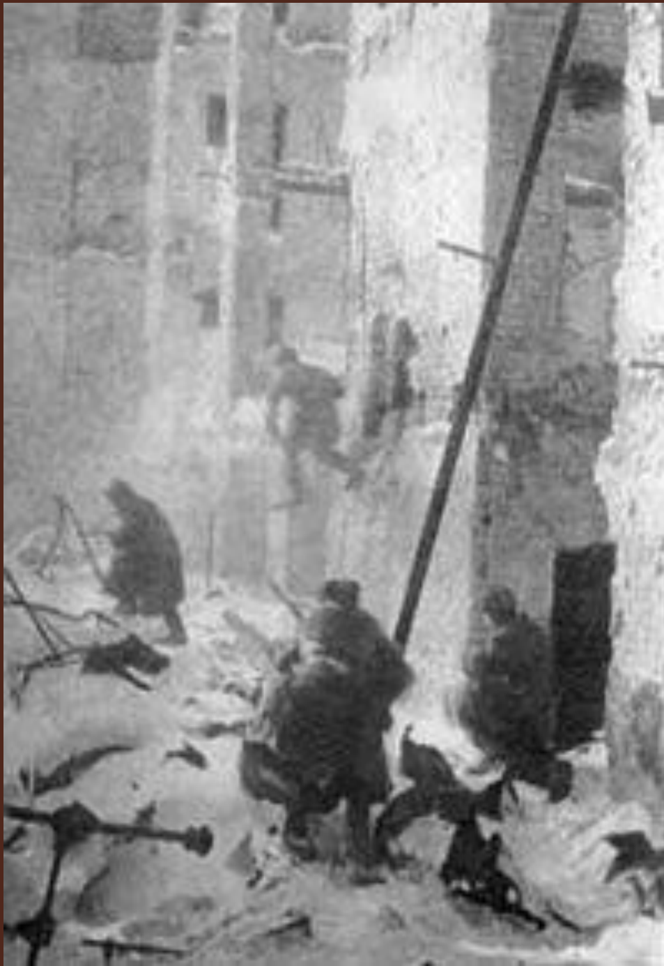
Уличные бои в Сталинграде