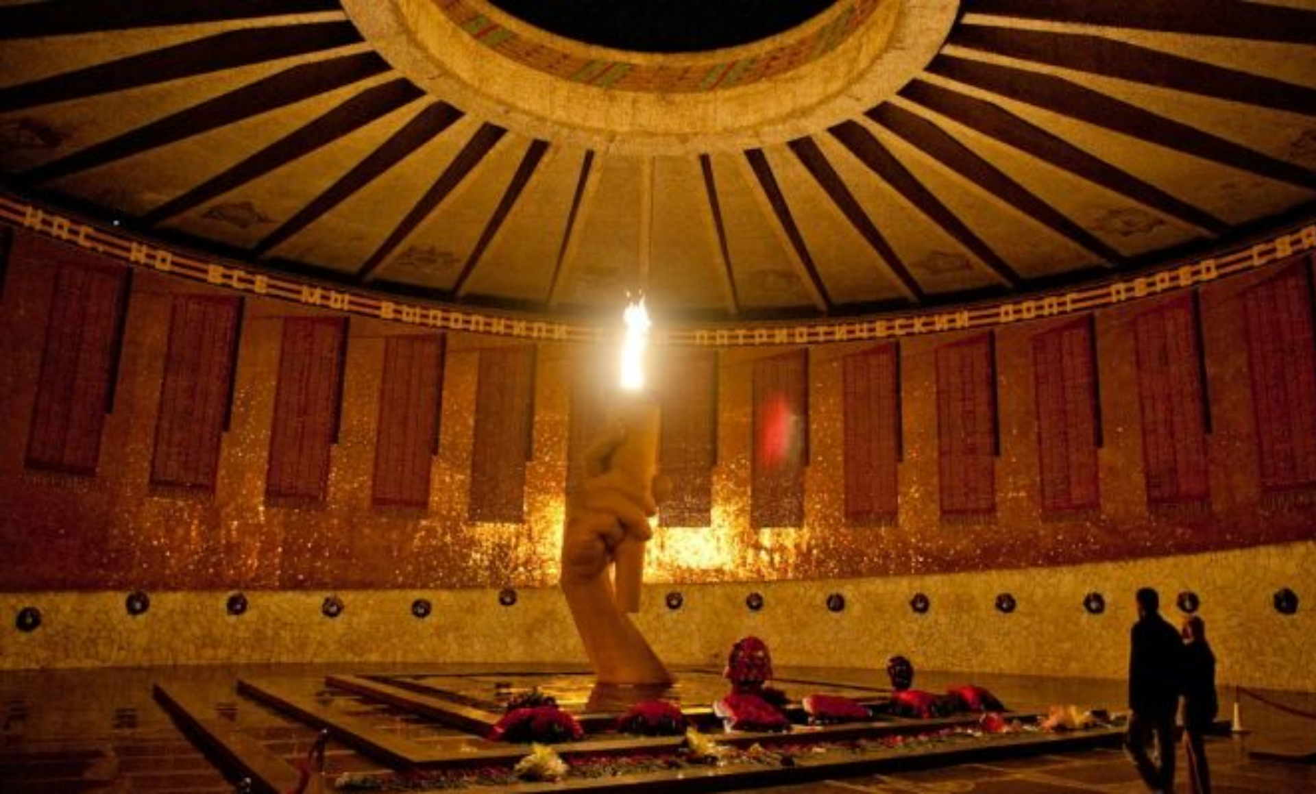
Волгоград. Мамаев курган. Зал Воинской славы