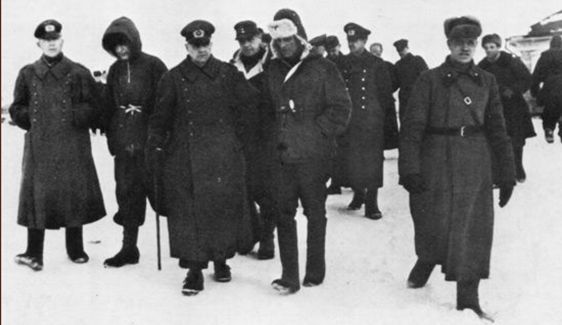
Генерал-фельдмаршал Ф. Паулюс и его генералы сдались в плен