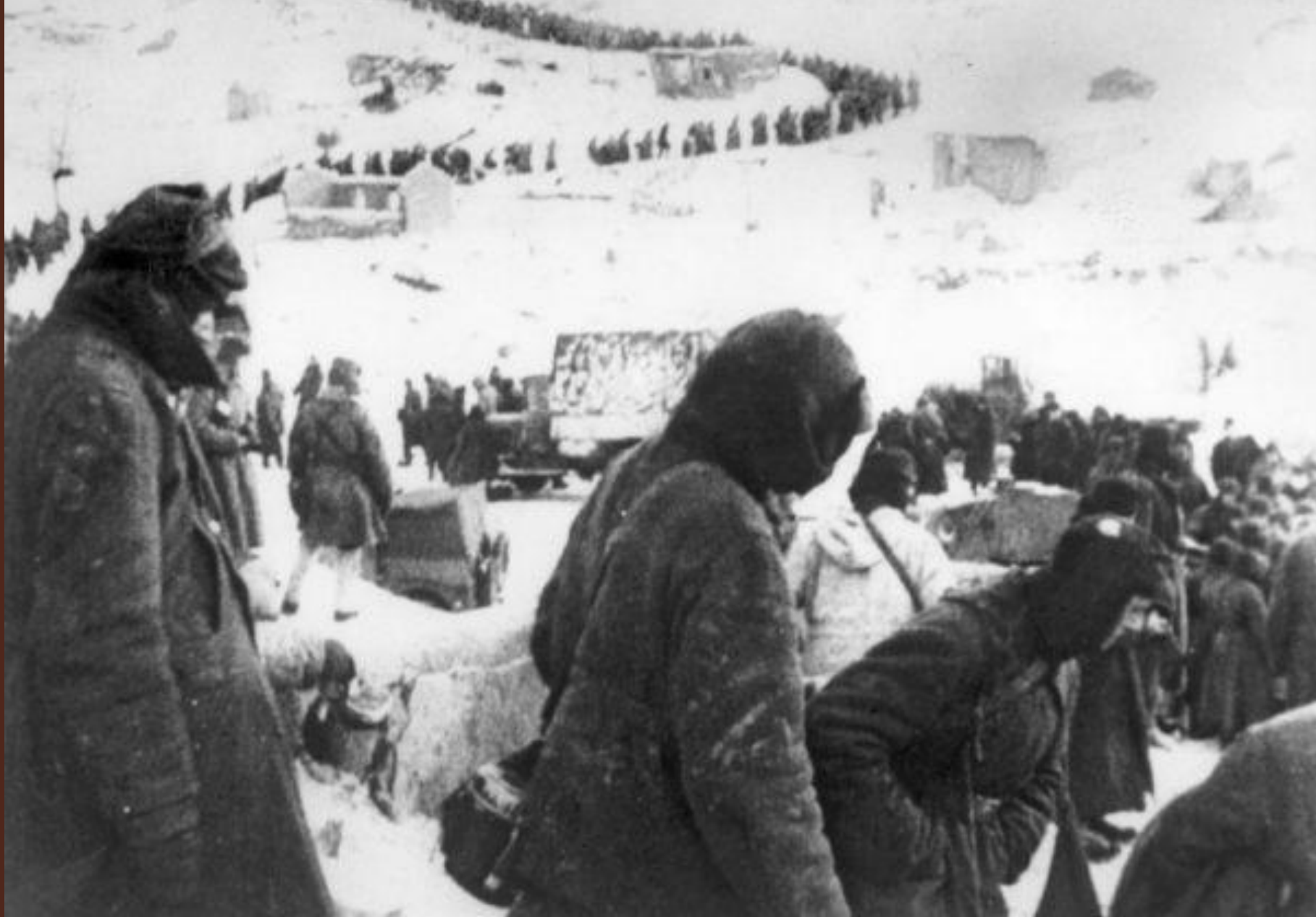
Сталинградская битва (колонна пленных немцев)