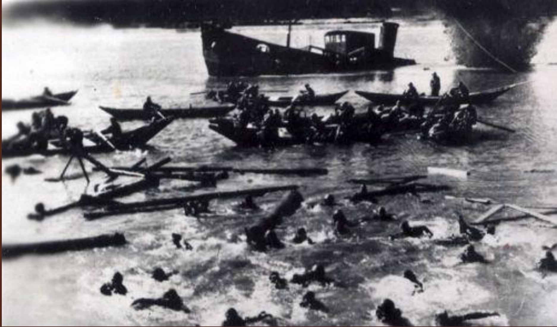
Переправа через Волгу