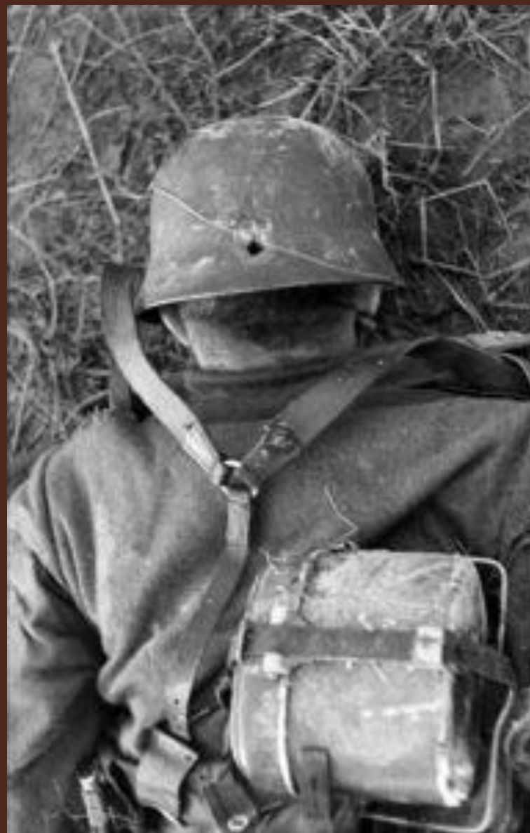
Фото убитых немцев (крайний правый - убит русским снайпером)