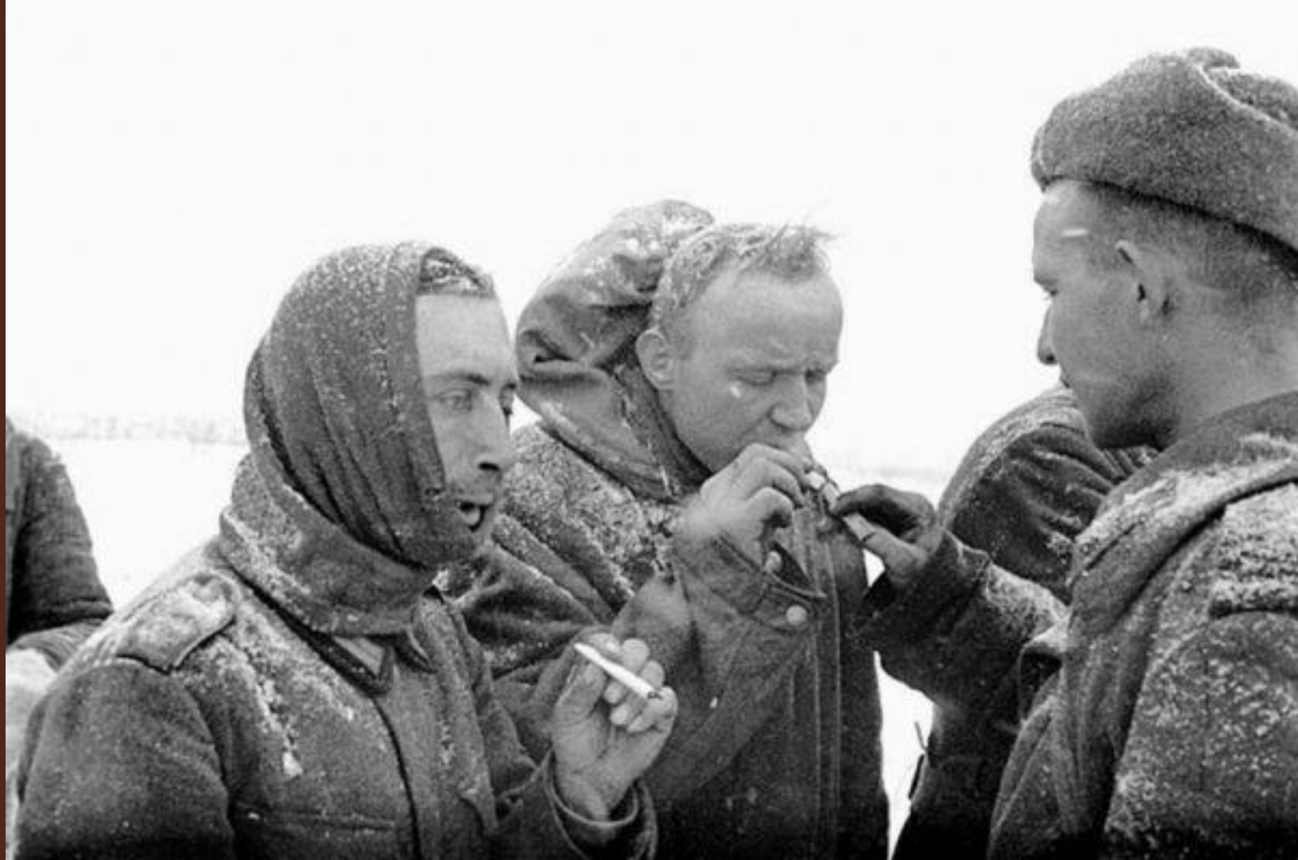
Тогда под Сталинградом наши отцы и деды вновь "дали прикурить" Фото: пленные немцы после Сталинградской битвы