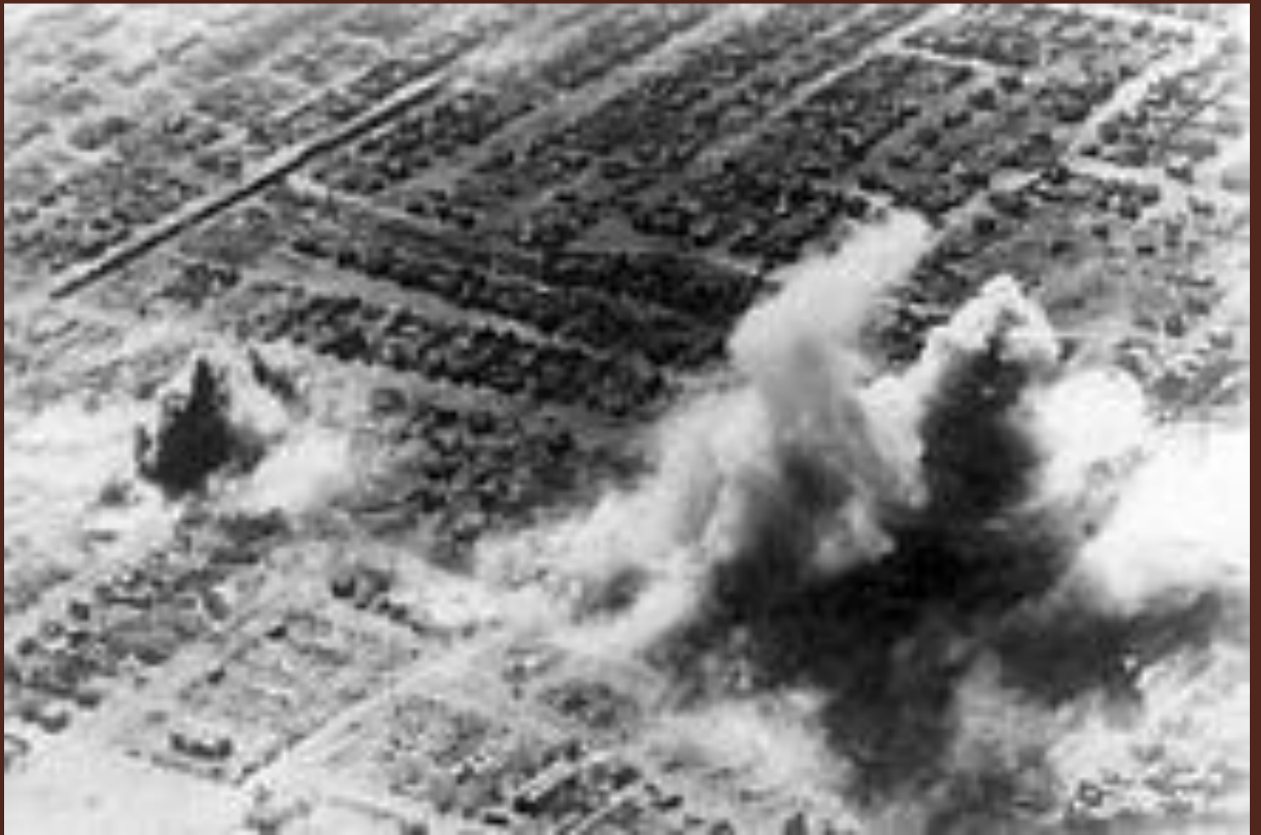
Люфтваффе проводит бомбардировку жилых районов Сталинграда, октябрь 1942 года