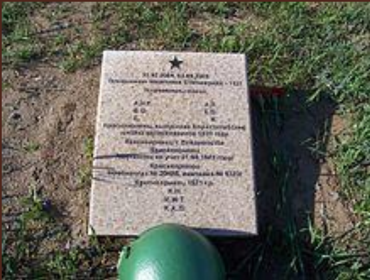
Братская могила советских солдат, найденных поисковыми отрядами.