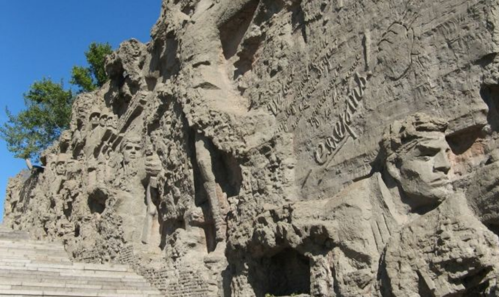
Фрагмент стен-руин. Призывы и клятвы защитников Сталинграда