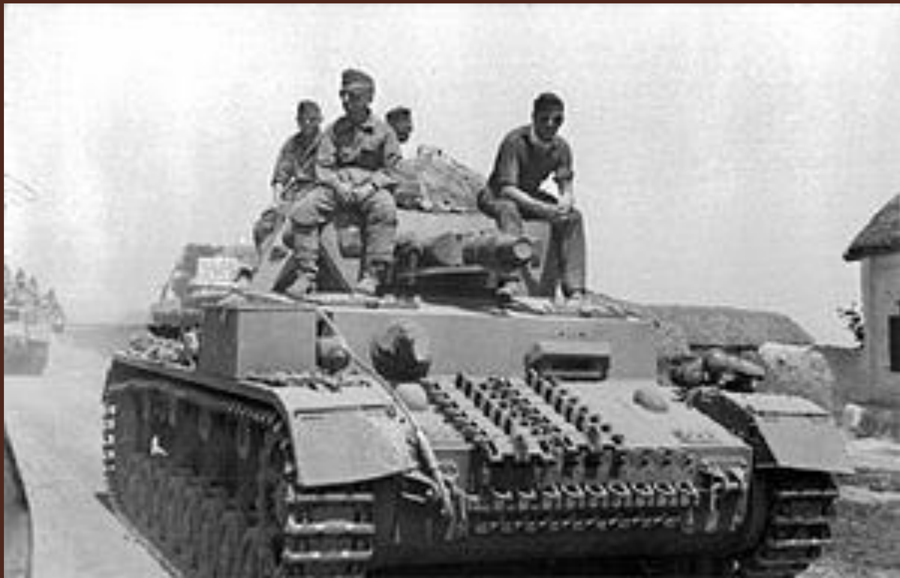
Наступление немецких войск.