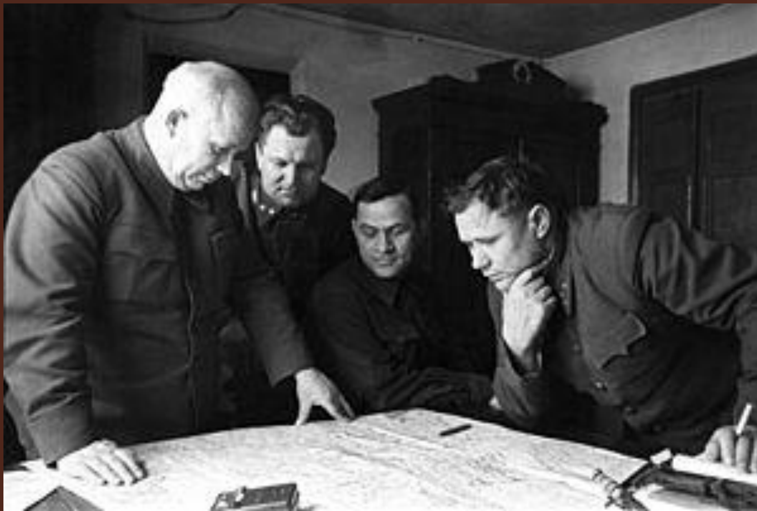
Члены Военного совета Сталинградского фронта: Хрущёв, Кириченко, Чуянов и комфронта Ерёменко, декабрь 1942