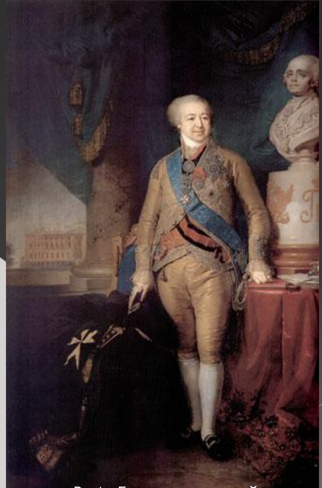
В. Л. Боровиковский Портрет вице-канцлера А. Б. Куракина