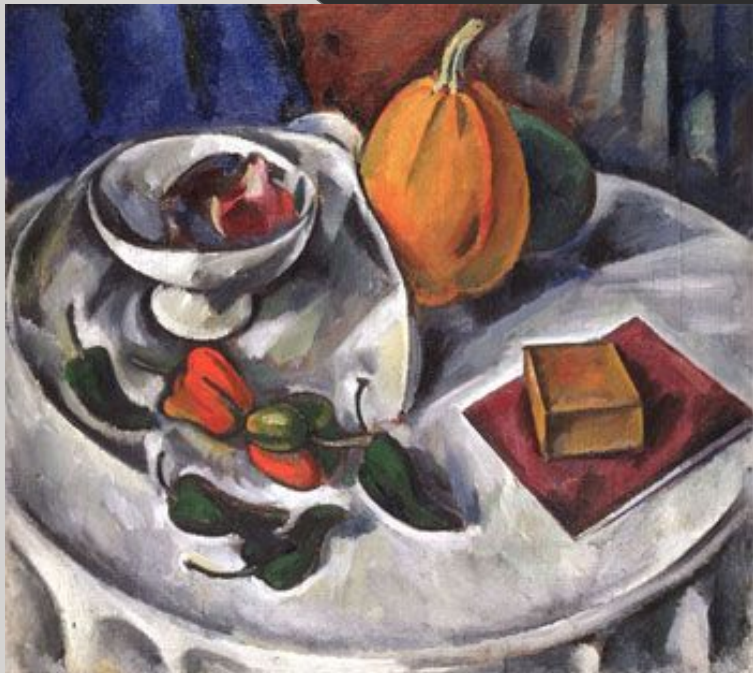
А. Куприн «Натюрморт»