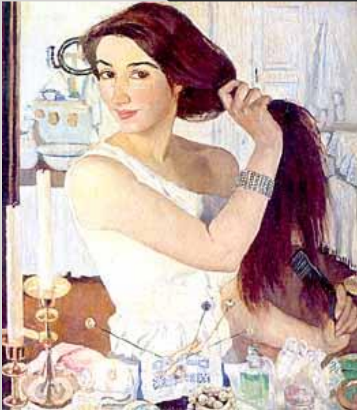
3. Серебрякова автопортрет