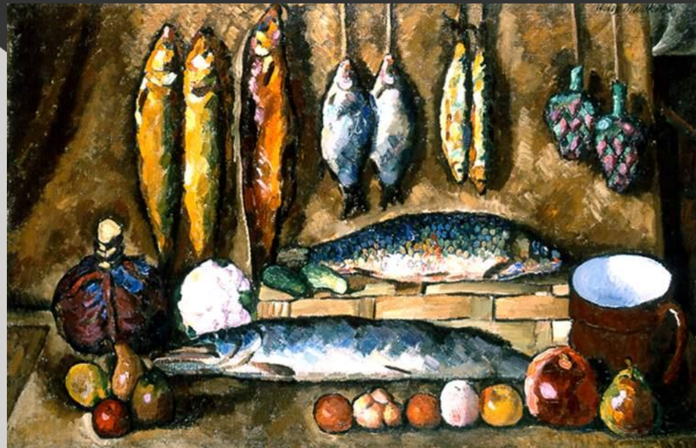
И. Машков «Натюрморт с рыбой»