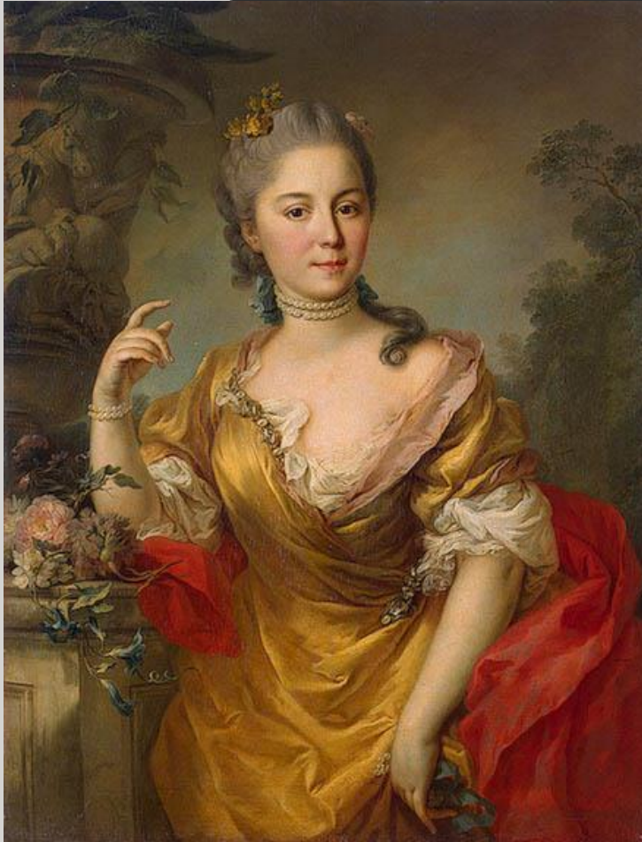
«Екатерина II в виде Минервы»

Костюмированный портрет- портрет , в котором человек представлен в виде аллегорического, мифологического, исторического, театрального или литературного персонажа. Обычно в наименования таких портретов включаются слова "в виде" или "в образе".