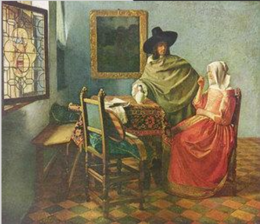
Вермер «Бокал вина»