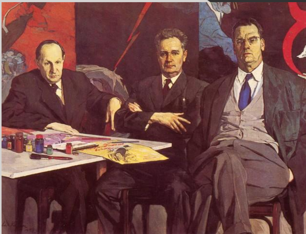
П. Д. Корин Портрет художников «Кукрыниксы»

Групповой портрет - портрет, включающий не менее трех персонажей.