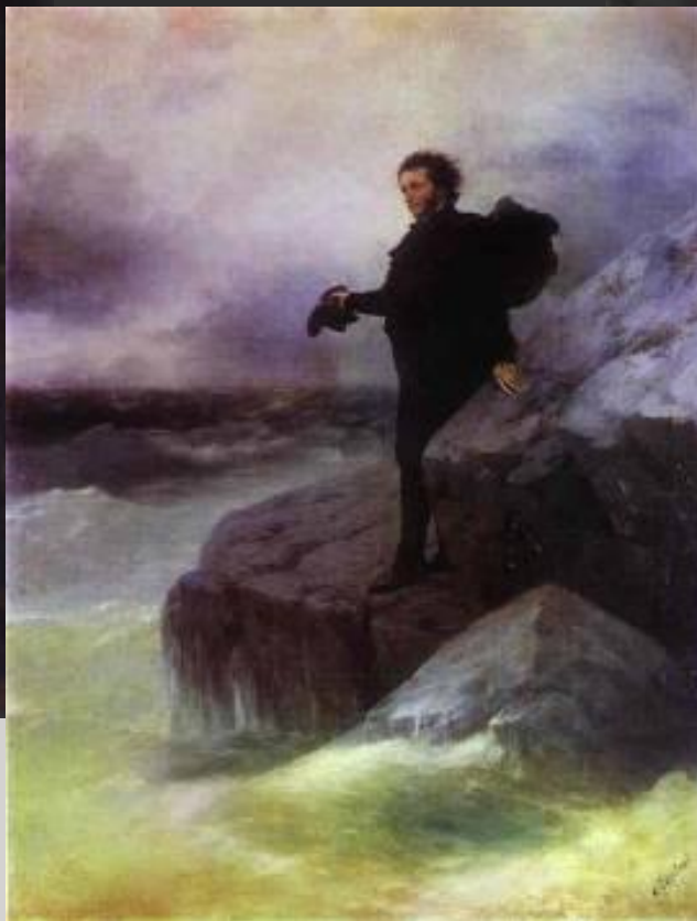
Айвазовский Н. Е. Репин