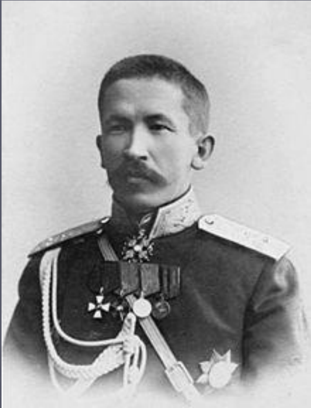
Генерального штаба генерал-лейтенант Л. Г. Корнилов. Петроград. 1916 г.

Корнилов отказал Керенскому в остановке продвижения на Петроград 3-го кавалерийского корпуса под командованием генерала Крымова, которое проводилось по требованию Временного правительства и было санкционировано Керенским, с целью окончательно покончить с большевиками и взять под контроль ситуацию в столице.