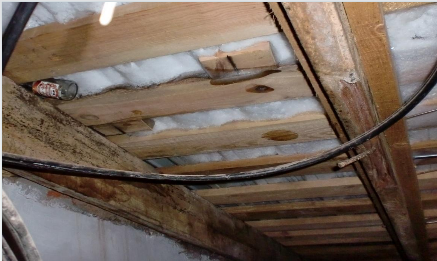
Образование сосулек и наледи

Последствия невыполнения мероприятий по восстановлению температурно-влажностного режима