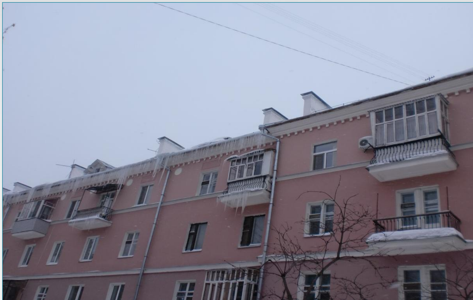
Образование сосулек и наледи

Последствия невыполнения мероприятий по восстановлению температурно-влажностного режима