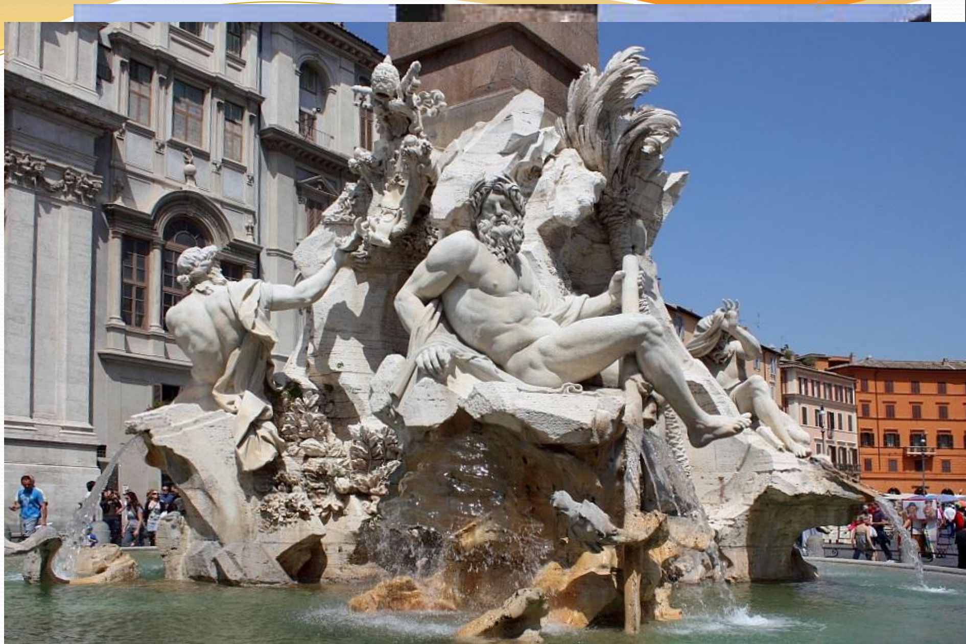
проекту Бернини. В 1644 г. папа Иннокентий X