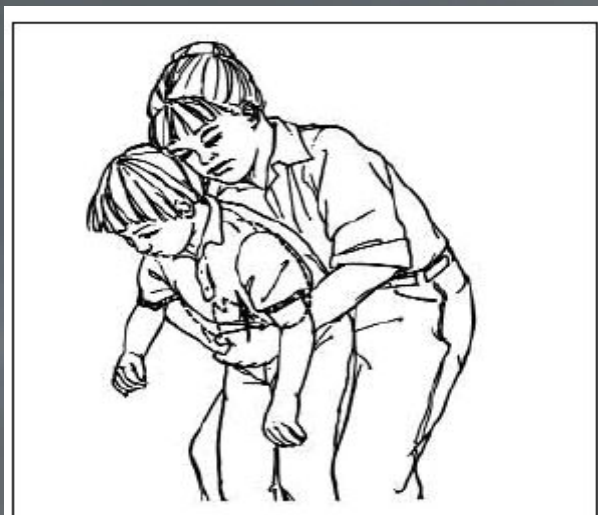
Рис. 8. Прием Хеймлиха