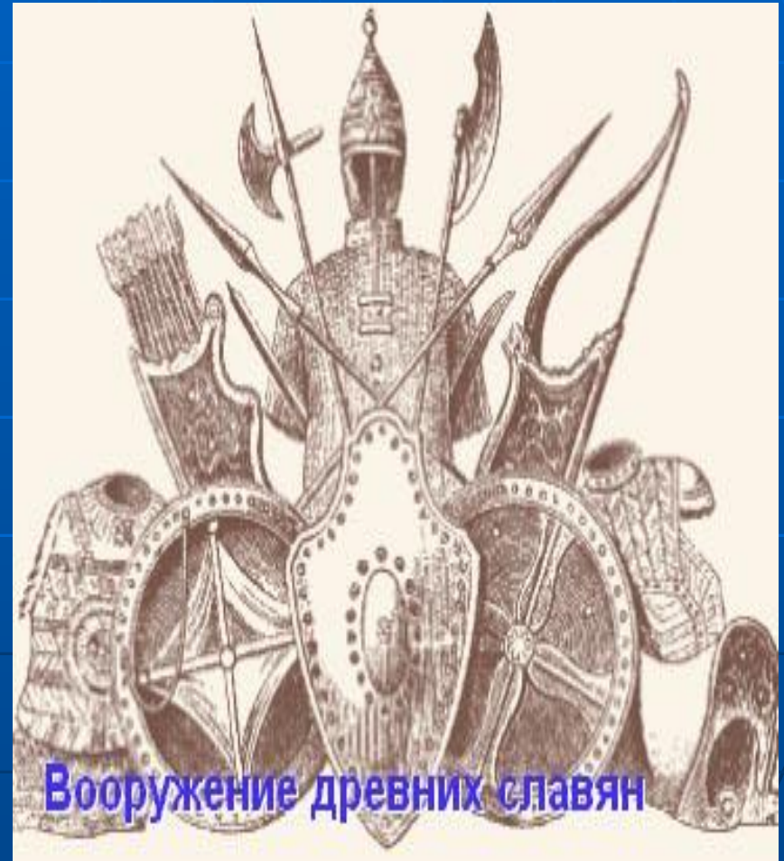
Вооружение древних славян