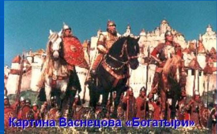
Картина Васнецова «Богатыри»