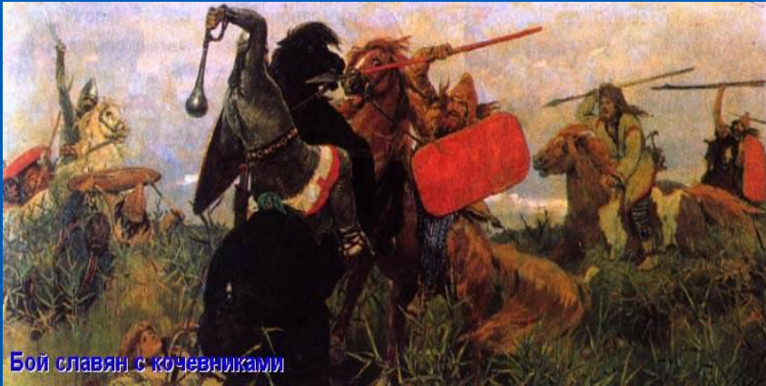
Бой славян с кочевниками