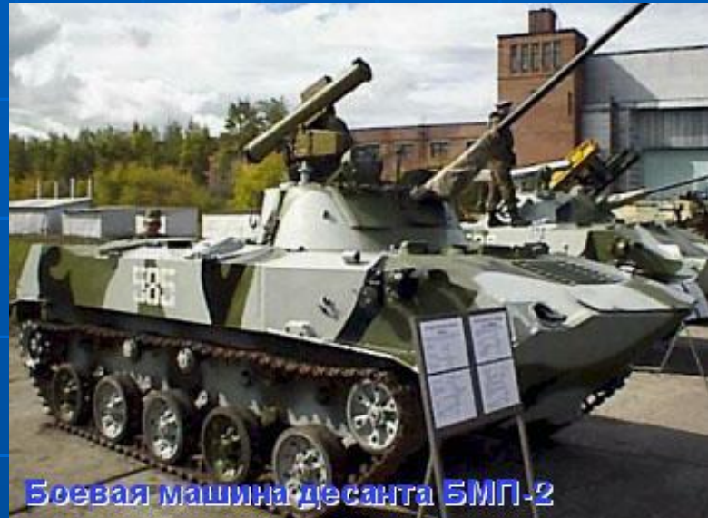
Боевая машина десанта БМП-2