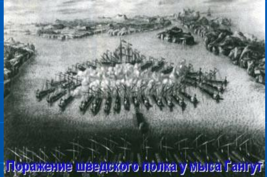
Поражение шведского полка у мыса Гангут