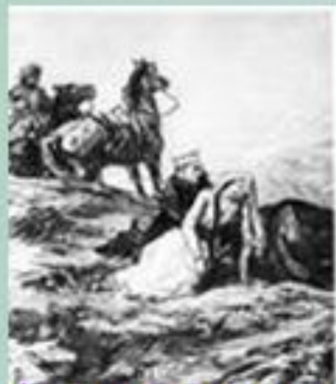
«Герой нашего времени»