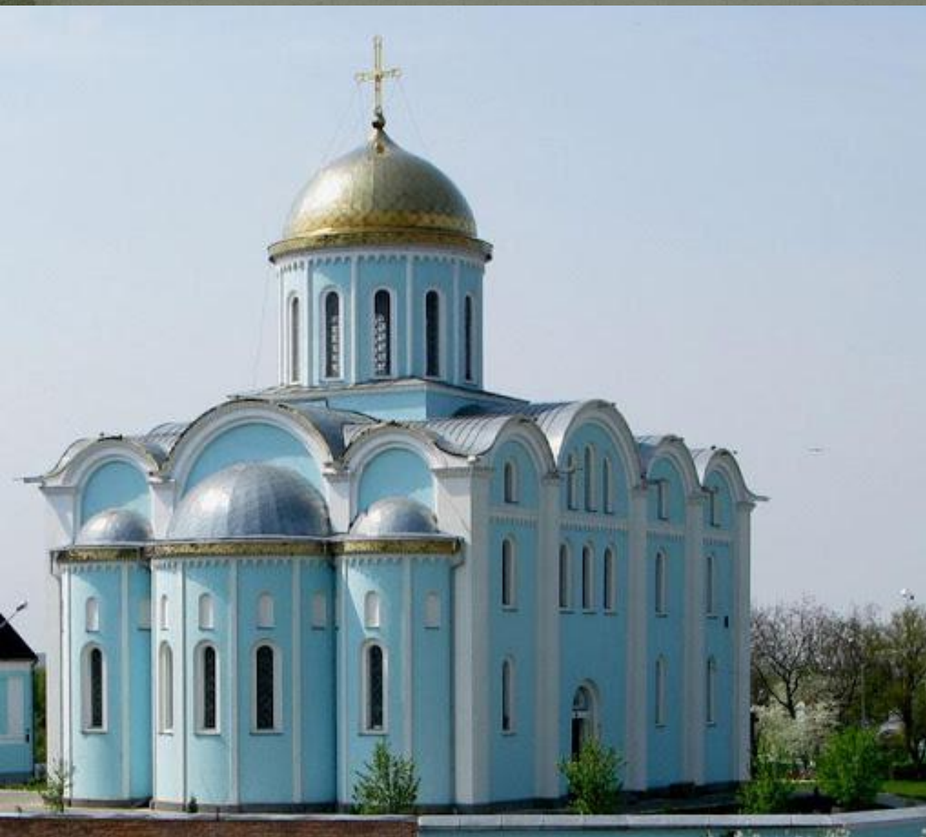
Успенский собор во Владимире-Волынском (XII в.)