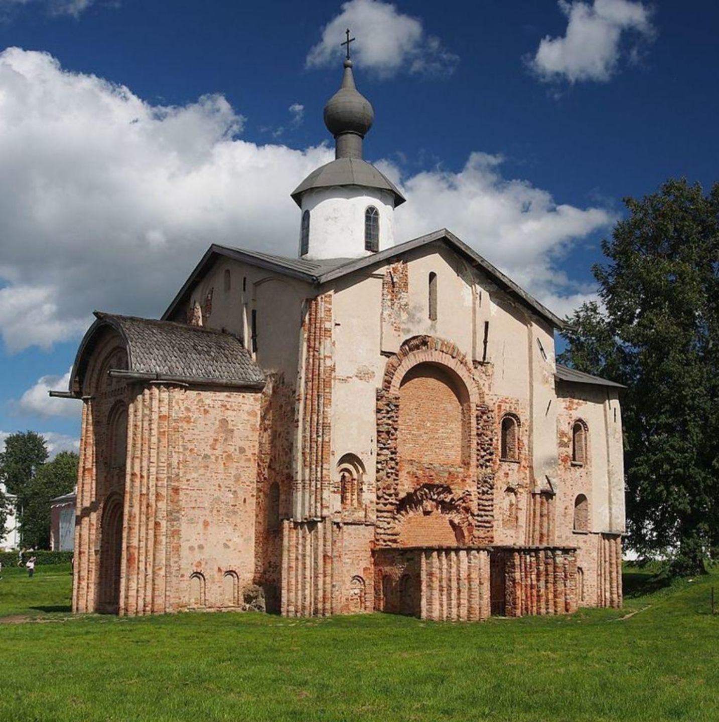
Церковь Параксевы- Пятницы на Торгу в Новгороде