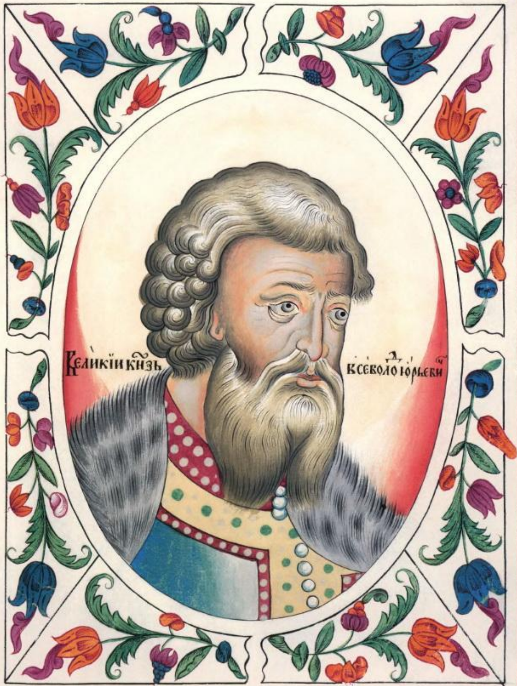
Всеволод Большое Гнездо