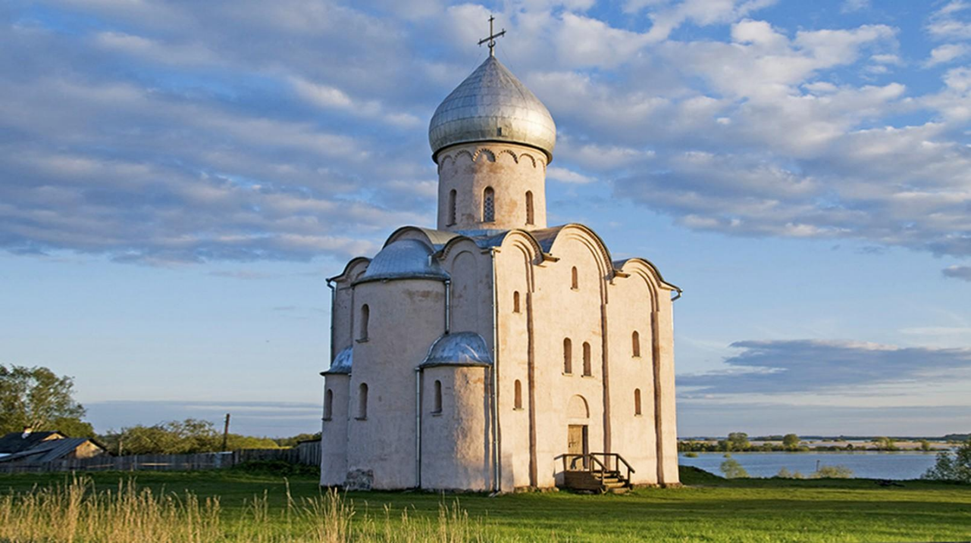
Церковь Спаса на Нередице