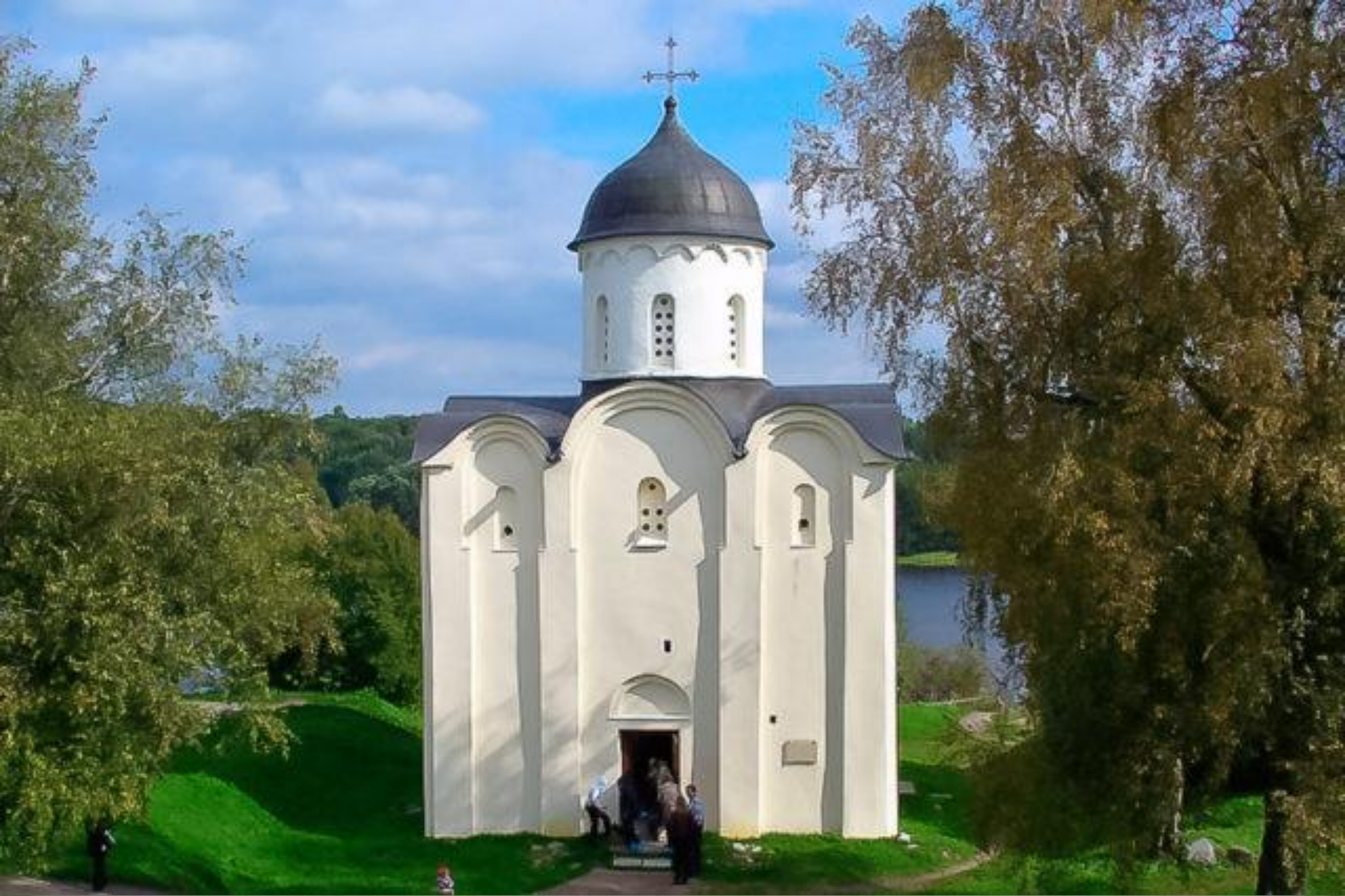
Церковь Святого Георгия в Ладоге