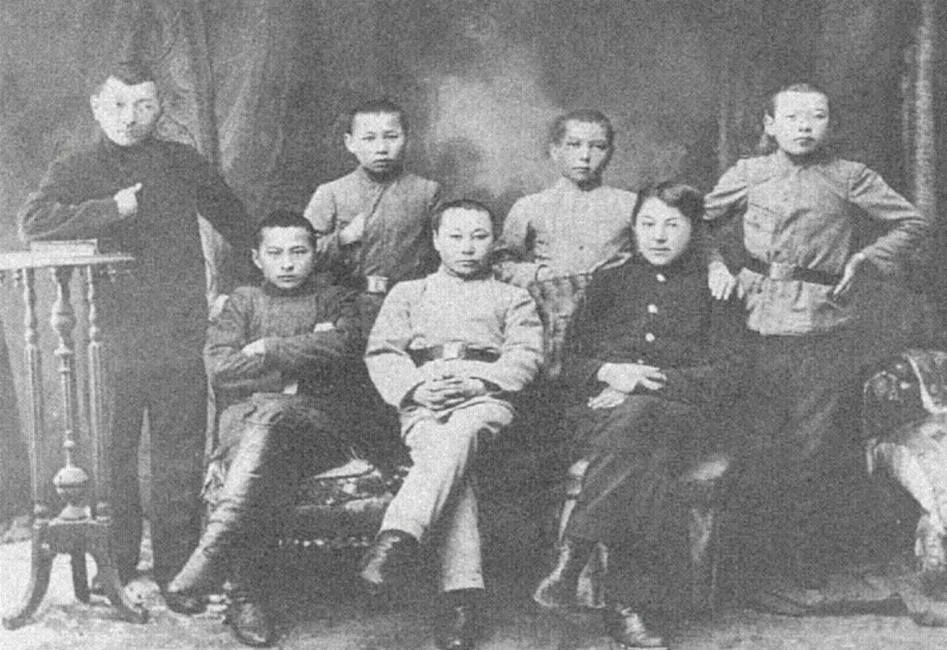
Ыбырай Алтынсарин мектебіндегі қазақ балалары