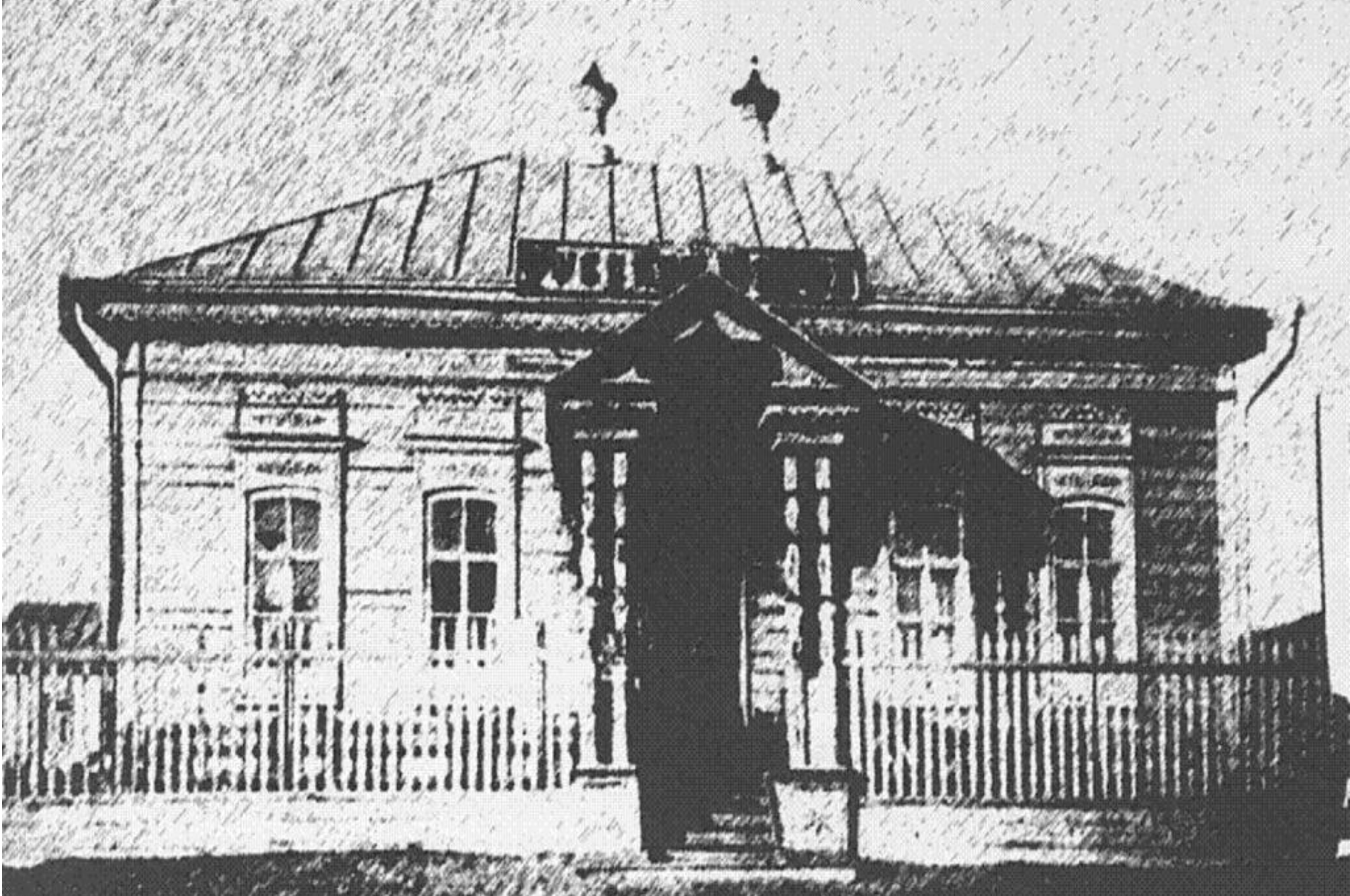
Торғайда Ыбырай Алтынсарин салдырған мектеп