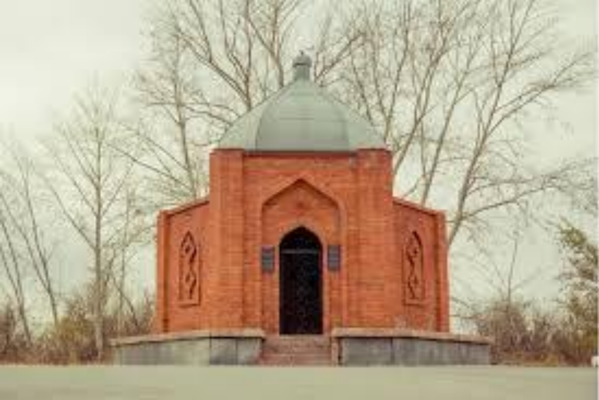
Ыбырай Алтынсарин кесенесі