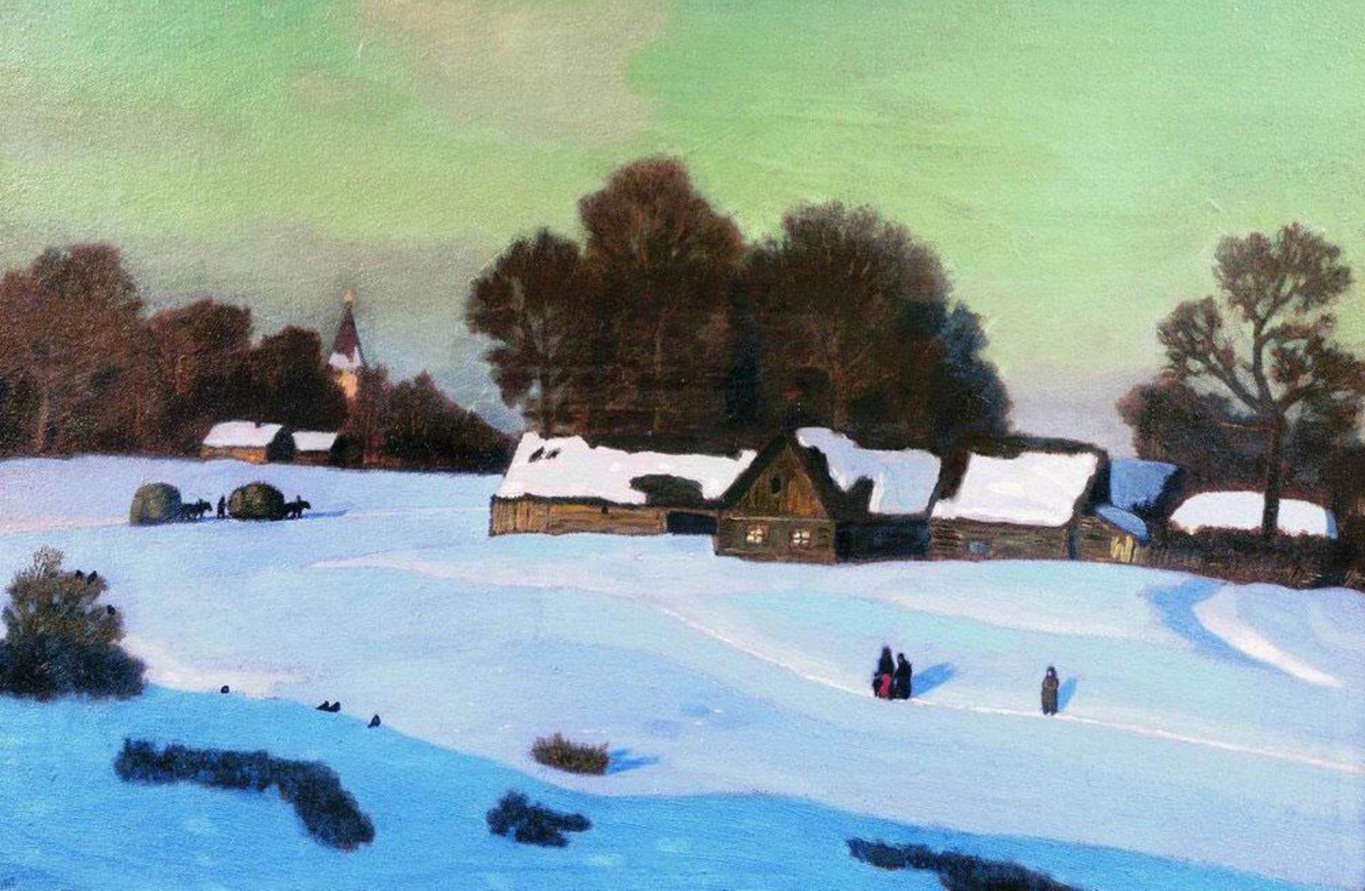
Н.П.Крымов «Зимний вечер», 1919г.