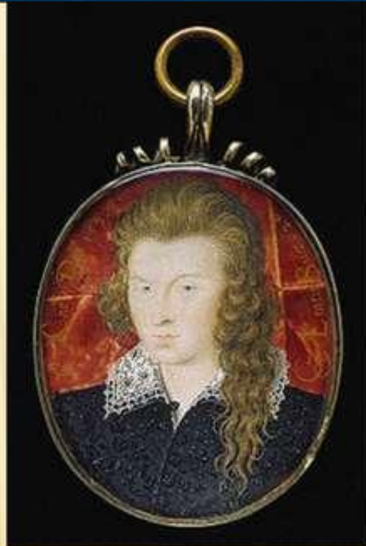
Портрет Генри Ризли, 3-его графа Саутгемптона