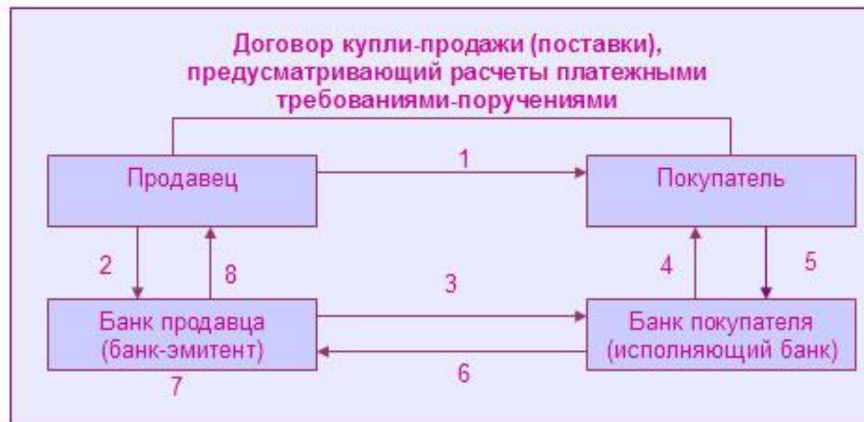
Схема расчетов с использованием платежных требований-поручений, подлежащих акцепту плательщика

1 — отгрузка товара, выполнение работ, услуг;