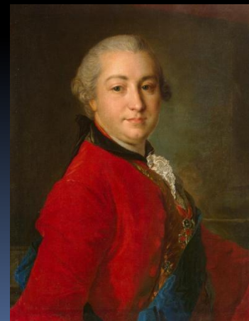
Граф Иван Иванович Шувалов