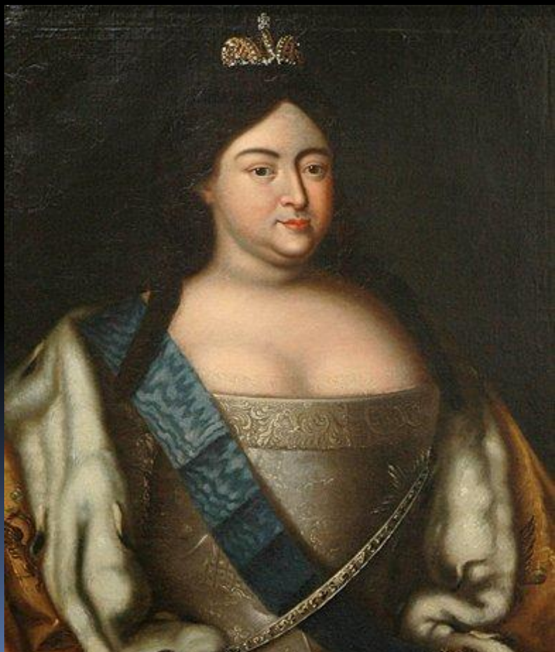
Императрица Анна Иоанновна