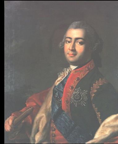
Алексей Григорьевич Разумовский