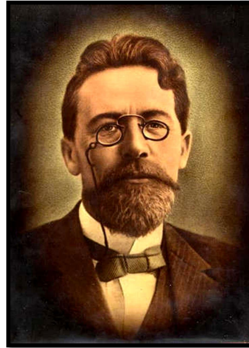
Антон Павлович Чехов ( 1860 –1904)

Признаки были очевидны. Потеря веса при таком росте, излишняя потливость, детализировали картину болезни. Последующие несколько лет болезнь набирала обороты. Чехов часто писал об этом в письмах и, очевидно, даже переносил на некоторых героев своих произведений.