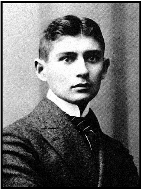
Франц Кафка (1883—1924)