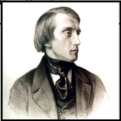
Виссарион Григорьевич Белинский (1811—1848)

Между тем здоровье Белинского, изнуряемое спешной журнальной работой, становилось всё хуже и хуже: у него уже развивалась чахотка. А. И. Герцен так описал Белинского в тот период: «Бледный, задыхающийся, с глазами, остановленными на том, с кем говорил, он дрожащей рукой поднимал платок ко рту и останавливался, глубоко огорчённый, уничтоженный своей физической слабостью» . Умер в 36 лет от туберкулеза в С.-Петербурге.