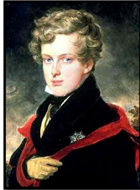
Наполеон II Бонапарт (1811 - 1832)