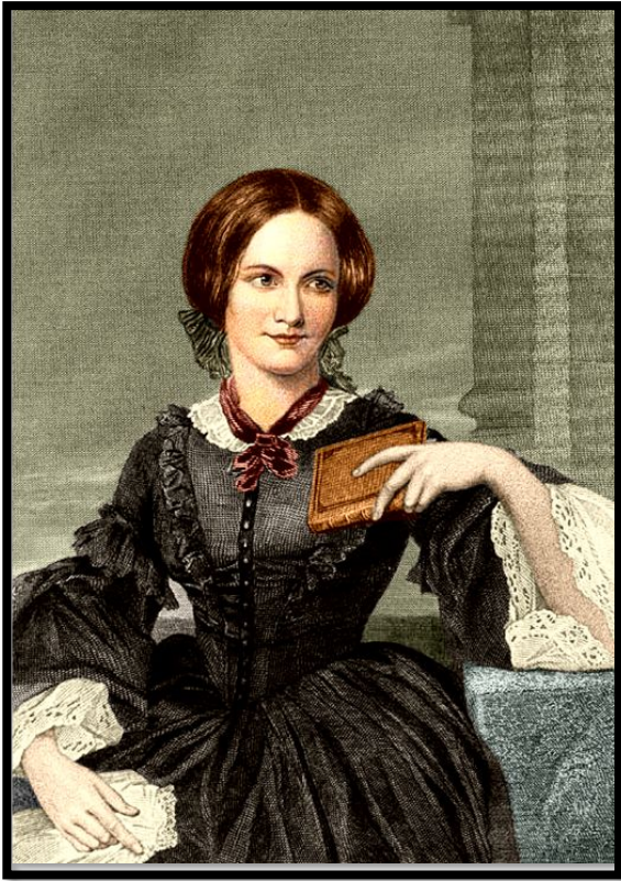
Шарлотта Бронте (1816 — 1855)