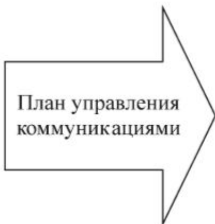
Схема распространения информации