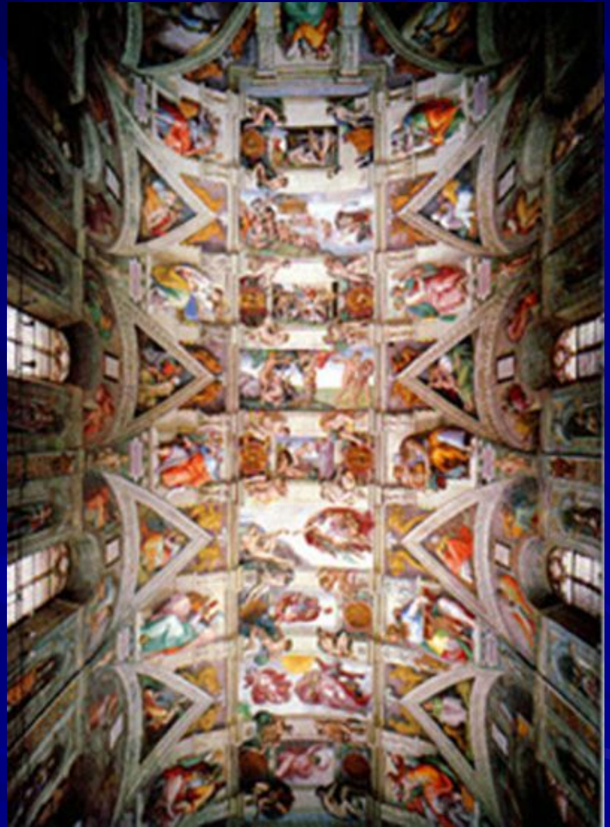
Свод Сикстинской капеллы: общий вид. 1508-1511. Фрески.