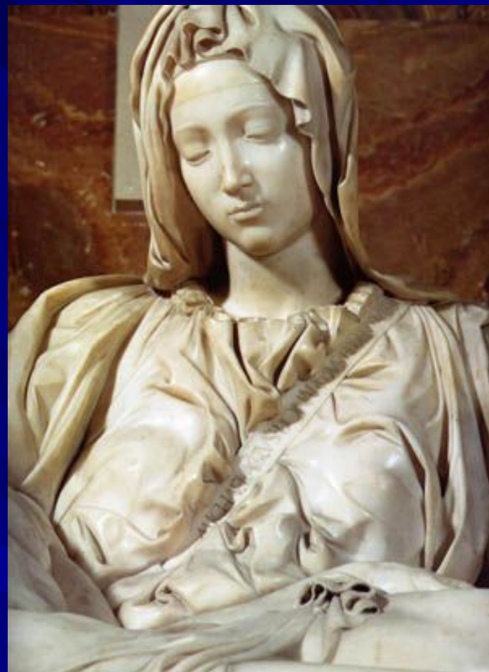
Пьета (Оплакивание Христа). 1498-1499. Мрамор. Собор Святого Петра, Ватикан,