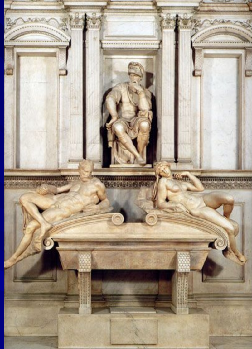
Гробница Лоренцо Медичи, герцога Урбинского (Капелла Медичи). ок. 1525. Мрамор. Новая сакрестия церкви Сан-Лоренцо, Флоренция.