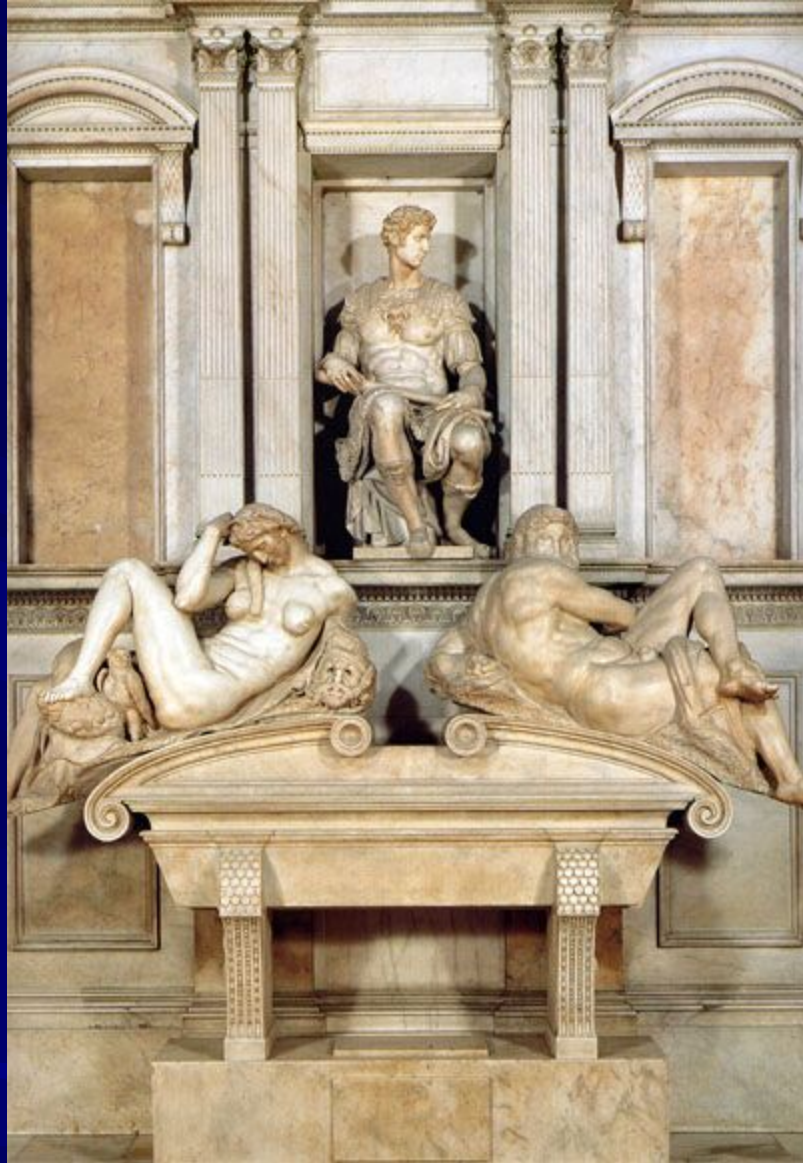
Гробница Джулиано Медичи, герцога Немурского (Капелла Медичи). 1526-1531. Мрамор. Новая сакрестия церкви Сан-Лоренцо, Флоренция.