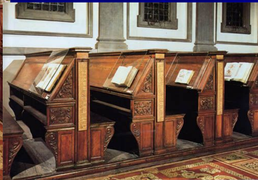
Читальный зал библиотеки Лауренциана. 1524. Библиотека Лауренциана, Флоренция.