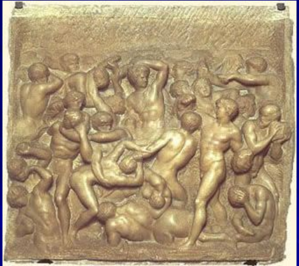
Битва кентавров. ок.1492. Мрамор. Размер: 84,5 x 90,5 см. Музей Буонарроти, Флоренция.