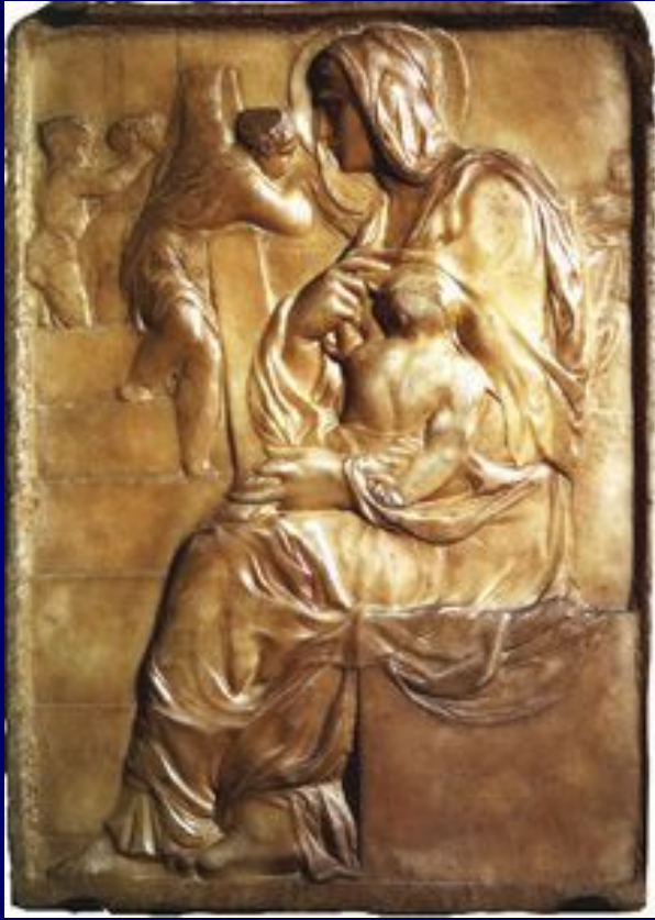
Мадонна у лестницы, 1490. Мрамор. Размер: 56,7 x 40,1 см. Музей Буонарроти, Флоренция.