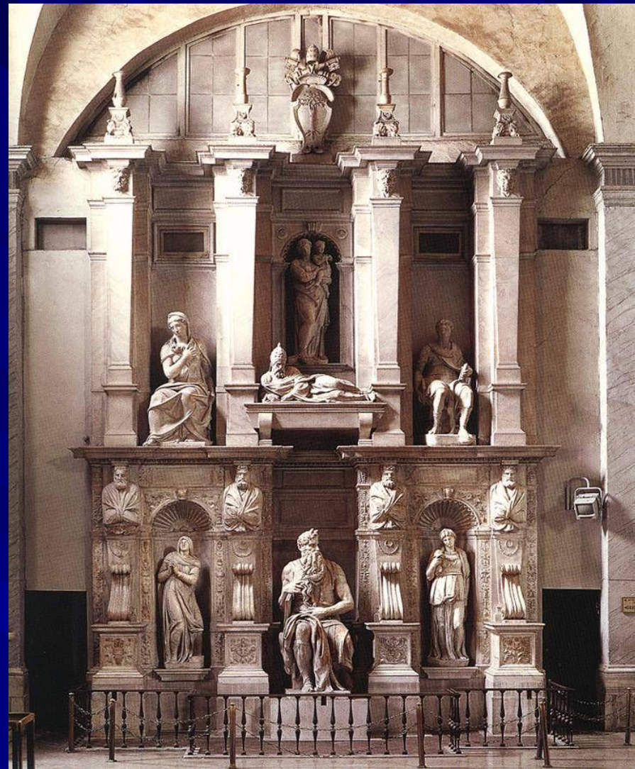
Гробница папы Юлия II: Моисей. ок. 1515. Мрамор. Высота: 235 см. Церковь Сан Пьетро ин Винколи, Рим