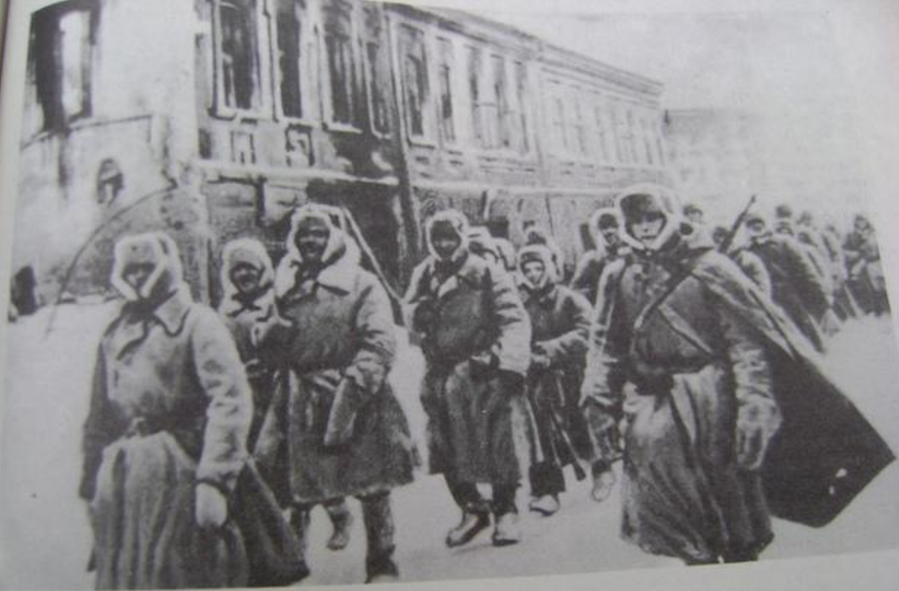
● Советская пехота вступает в Медынь. 14 января 1942 г.