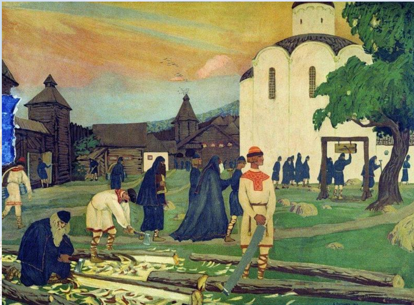
Кустодиев Борис Михайлович