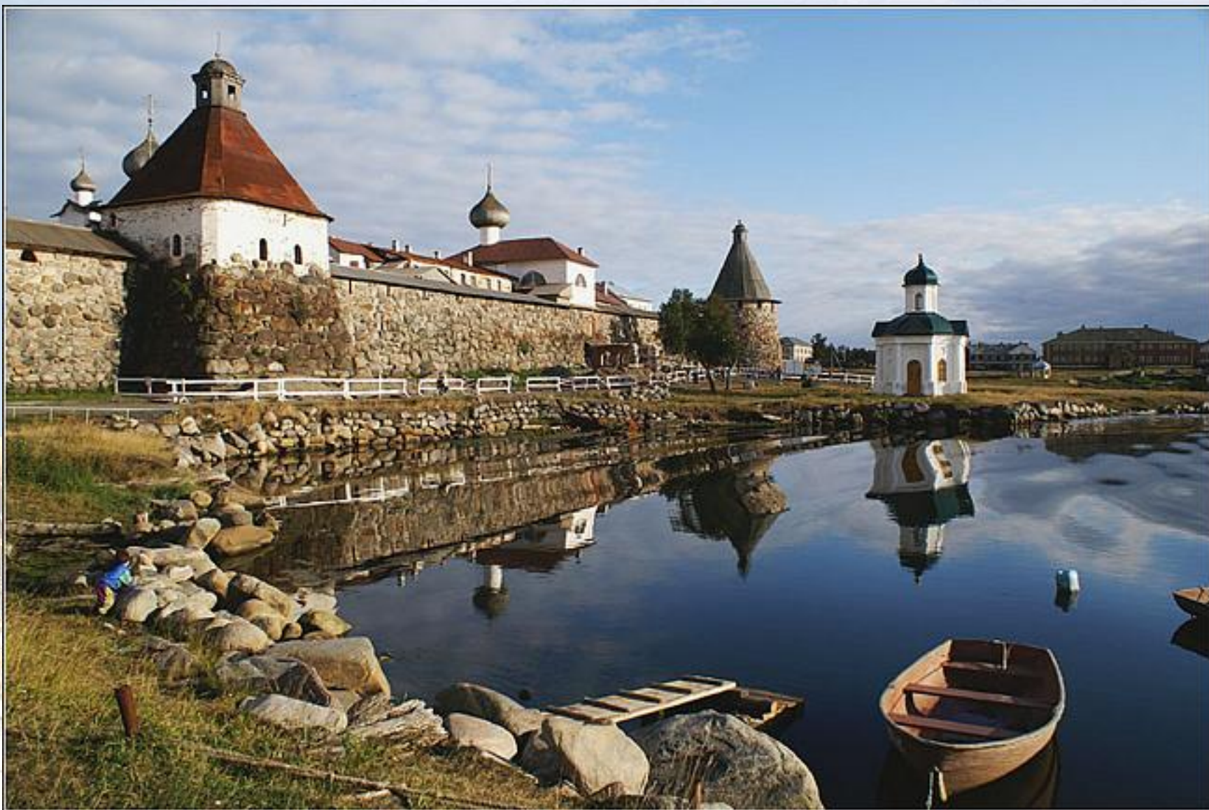
Соловецкий монастырь, 1420 – 1430гг.