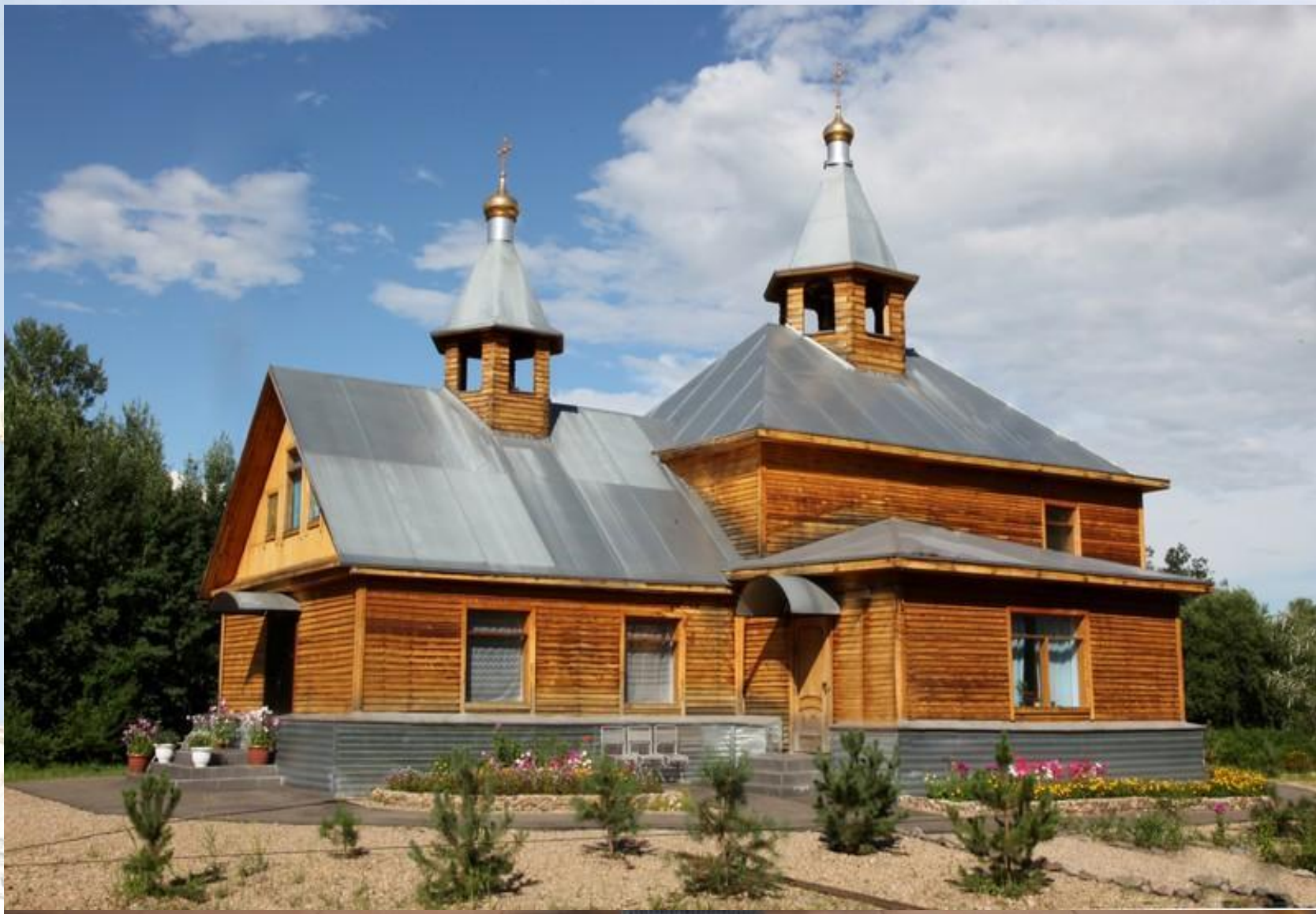
Женский монастырь во имя святителя Иннокентия, митрополита Московского, с. Раздольное (2007г.)