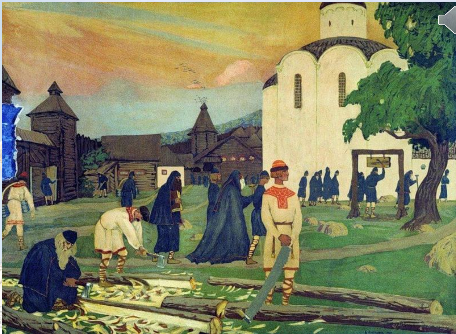
Кустодиев Борис Михайлович «В монастыре» (1907 г.)