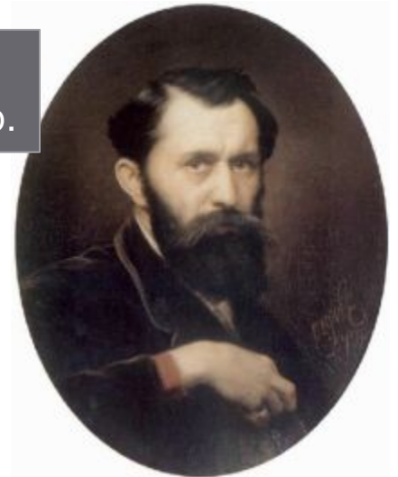
Василий Перов. Автопортрет. 1870.