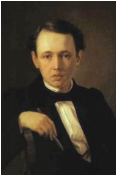
Василий Перов. Автопортрет. 1851.