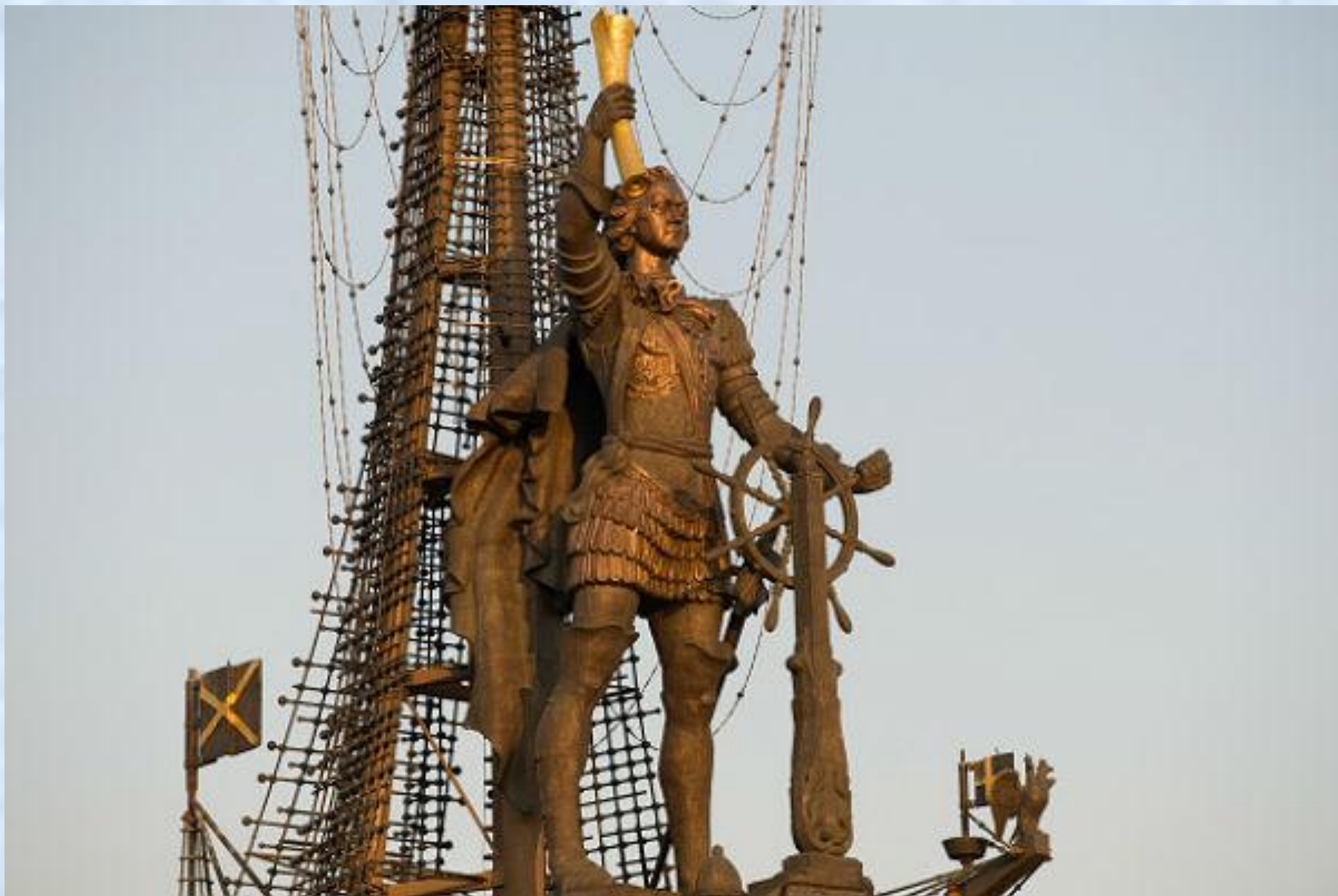
Памятник Петру I. Воздвигнут в 1997.