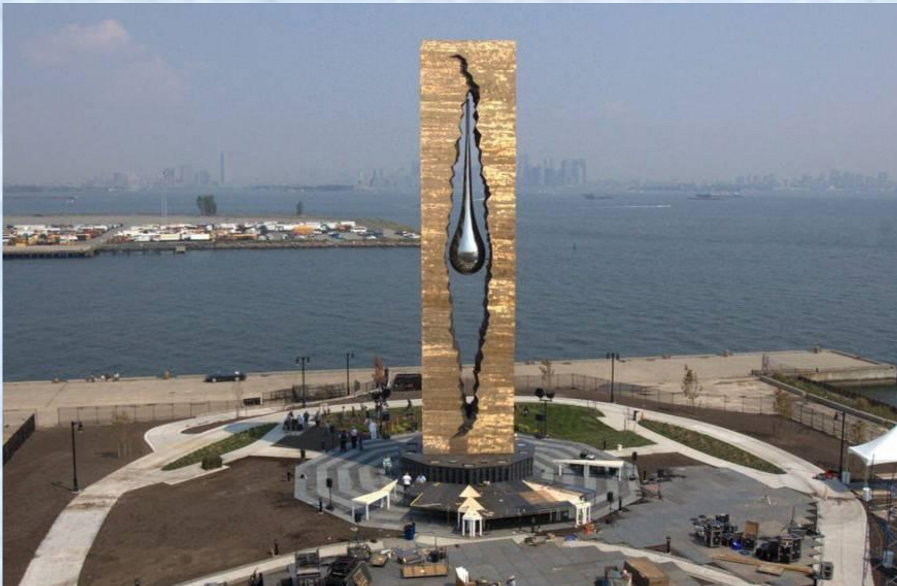
монумент "Слеза скорби"