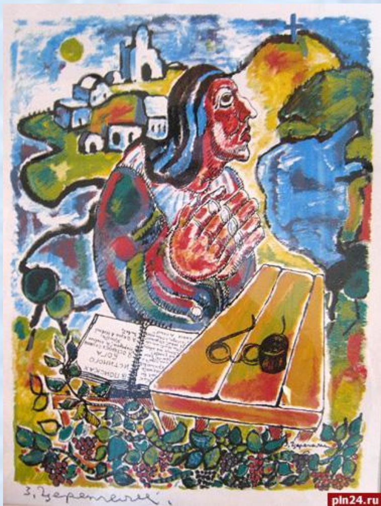
картины З. Церетели