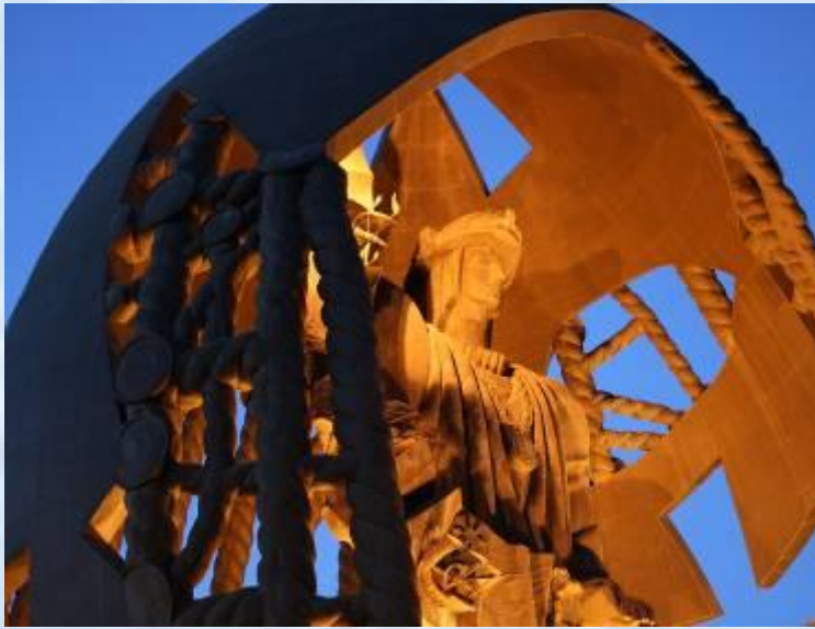
Испания. Севилья. Памятник Колумбу.