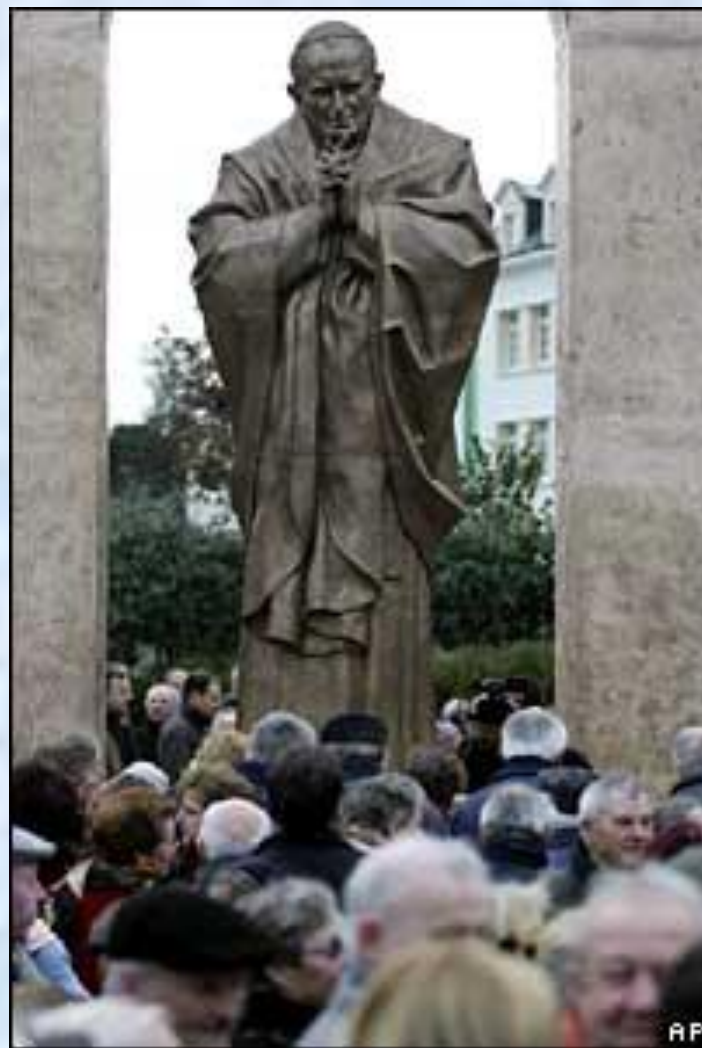
Памятник Иоанну Павлу II в городе Плоэрмель