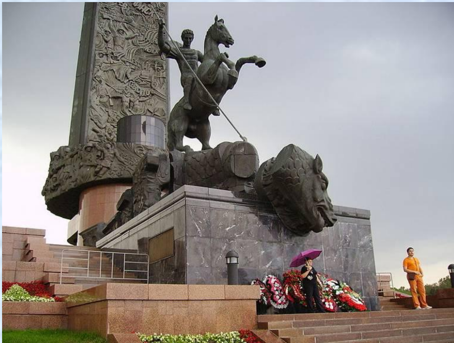
Статуя Георгия Победоносца на Поклонной горе.