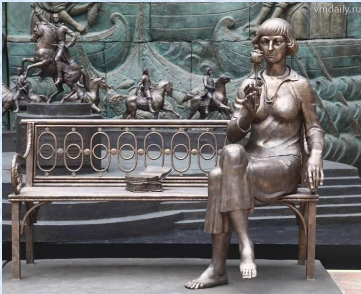
памятник Марине Цветаевой