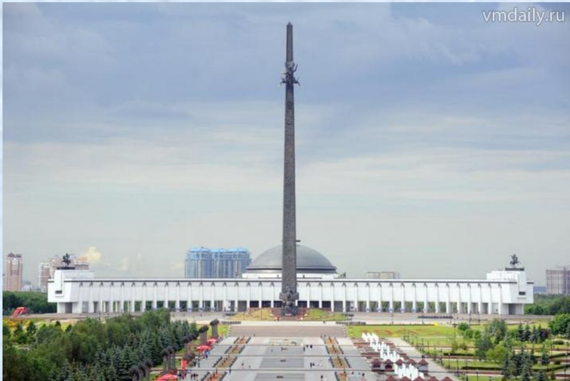
мемориальный комплекс на Поклонной горе